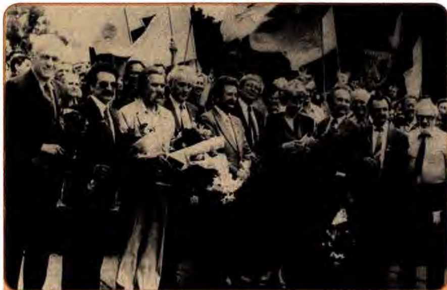
В. Чорновіл (третій праворуч) та інші діячі Народного руху України на мітингу. Київ, 1990 р.

Народний рух України за перебудову, як найбільша з новостворених громадсько-політичних організацій, зробив чимало для демократизації виборчої системи в республіці, утвердження української мови як державної, оприлюднення правди про трагічні сторінки історії українського народу. На адресу Руху з боку Компартії України посипалося безліч критичних стріл.