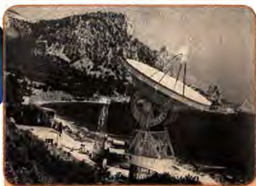
Радіотелескоп Кримської астрофізичної обсерваторії АН СРСР. 1978 р.

виток її найважливіших напрямів. XXIV з'їздом КПРС у 1971 р. було поставлене завдання – «органічно з'єднати досягнення науково-технічної революції з перевагами соціалізму». Але радянському режимові виявилось не під силу належним чином скористатися досягненнями НТР. Відсутність інтелектуальної свободи гальмувала прогрес радянської науки. Згубний вплив на неї справляла також штучна ізоляція вчених СРСР від світового наукового співтовариства.