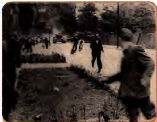
Польські страйкарі втікають від радянського танка. Познань. 1956 р.

Не допускаючи виходу жодної країни з так званого соцтабору, Радянський Союз у той же час прагнув роз-