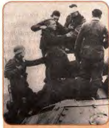
Німецькі солдати й полонені червоноармійці на підбитому танку. 1941 р.

Київ. Війська фронту розбилися на численні загони й групи, кожна з яких самостійно виривалася з оточення. Тисячі солдатів та командирів загинули, переважна більшість особового складу фронту – понад 665 тис. – потрапила до німецького полону. Доля фронту спіткала і його командування. Штабна колона була оточена фашистськими військами біля урочища Шумейки на Полтавщині. У бою загинули командувач Південно-Західного фронту генерал-полковник М. Кирпонос, член Військової ради М. Бурмистенко, начальник штабу фронту генерал В. Тупіков і сотні командирів військ фронту. Трагедія Південно-Західного фронту була однією з найбільших невдач Червоної армії у 1941 р.