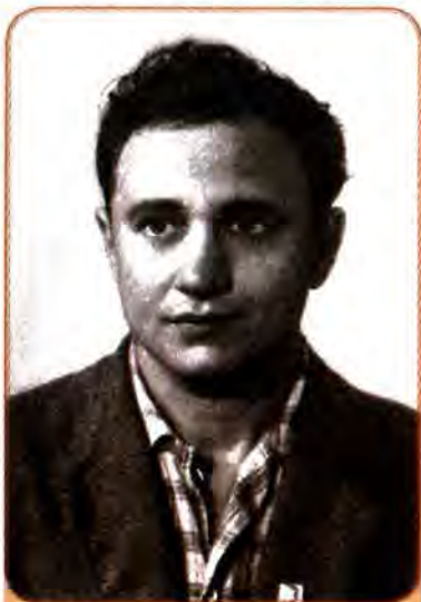
Валерій Шевчук – український письменник-«шістдесятник», майстер психологічної прози. 1960 рр.

Горська, Людмила Семикіна, Галина Севрук, Панас Заливаха, Веніамін Кушнір.