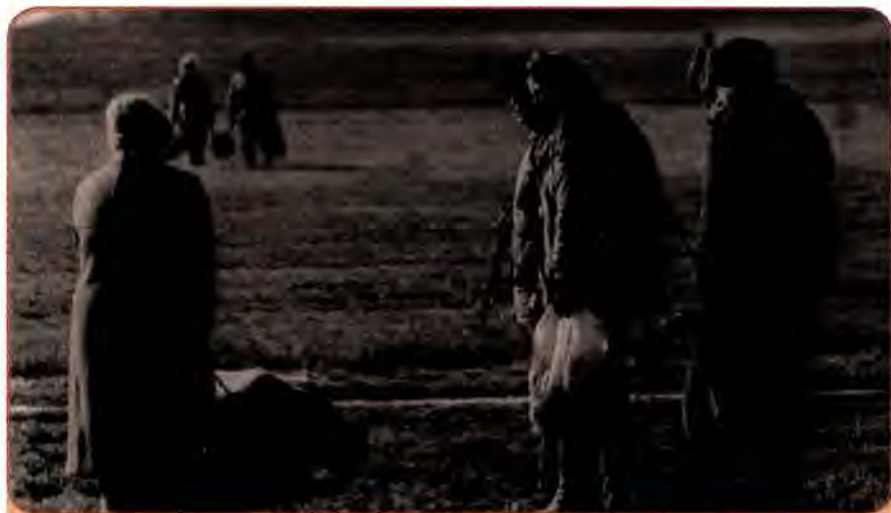
Кияни на колгоспному полі «дозбирають» урожай, 1993 р.

На початку 2000-х років, у зв'язку з економічним оздоровленням, життєвий рівень населення почав зростати, істотно скоротилася заборгованість із заробітної плати. Усі пенсії було повністю виплачено. Доходи населення за даними офіційної статистики в 2001–2005 рр. збільшилися з 158 млрд до 323 млрд грн. Почався споживчий бум: населення почало купувати речі