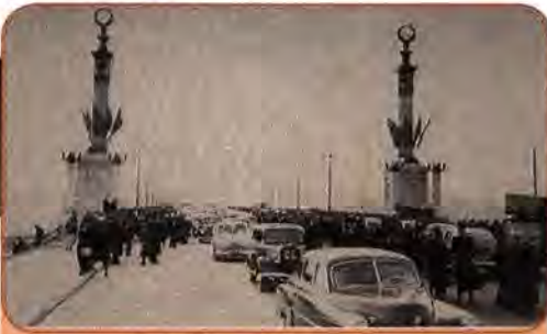
Урочисте відкриття мосту ім. Є. Патона – перший у світі суцільнозварений міст. Київ. 1953 р.

туту синтетичних надтвердих матеріалів АН УРСР 1961 р. одержав перші штучні алмази. Україна залишилася центром досліджень у галузі електрозварювання, яку очолював академік, президент АН УРСР Б. Патон.