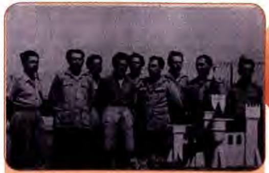
Українці, які відмовилися повертатися в Радянську Україну, де панував тоталітарний режим. Табір для переміщених осіб. Ріміні (Італія). 1945 р.