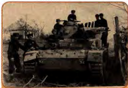
Радянські танкісти перед наступом на м. Харків. 1942 р.

А 19 лютого німецьке командування здійснило контрудар з районів