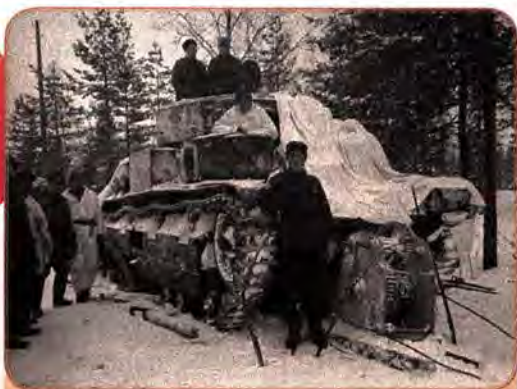
Солдати фінської армії біля захопленого радянського танка. 1939 р.

регла незалежність, а радянські втрати вбитими і зниклими безвісти становили майже 200 тис. осіб. Серед них були десятки тисяч жителів України.