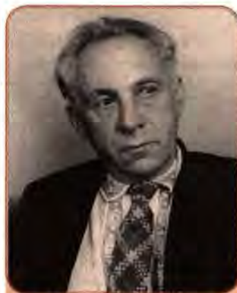
Максим Рильський видатний український поет, перекладач

Зрозуміло, що репресії та утиски творчої інтелігенції не могли не зачепити українських митців. Западливі сталінські прислужники в ЦК КП(б)У, відповідно до рішень ЦК ВКП(б), прийняли свої постанови: «Про перекручення і помилки у висвітленні історії української літератури в “Нарисі історії української літератури”», «Про журнал сатири і гумору “Перець”», «Про журнал “Вітчизна”», «Про репертуар драматичних і оперних театрів УРСР і заходи щодо його поліпшення». Кожна з цих постанов су-