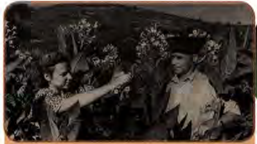
Тютюнова плантація колгоспу ім. С. Кірова на Закарпатті. 1954 р.

ного господарства. Після смерті Сталіна ставлення партійно-державного керівництва до села та його проблем поступово змінюється. Гострота продовольчої проблеми не зменшувалася і загрожувала зривом планів нарощування промислової могутності та провалом зовнішньополітичних задумів. Це спонукало до пошуку нових шляхів піднесення сільськогосподарського виробництва, його ефективності. У вересні 1953 р. пленум ЦК КПРС розглянув питання про становище сільського господарства СРСР. У по-