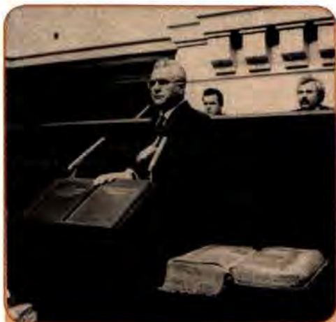
Л. Кравчук складає присягу Президента України на пленарному засіданні Верховної Ради. Київ. 5 грудня 1991 р.

Референдум 1 грудня 1991 р. увійшов в історію України як одна з найсвітліших подій, день національної гідності її народу. На запитання в бюлетені для голосування на всеукраїнському референдумі «Чи підтверджуєте Ви Акт проголошення незалежності України?» 90,32 % виборців відповіли: «Так, підтверджую».