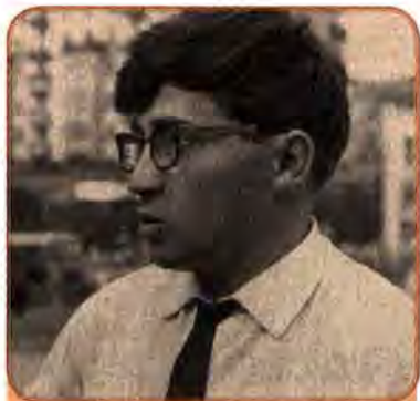
Євген Гуцало – український прозаїк. 1960 рр.

У 60-х роках ім'я київського письменника В. Некрасова тісно пов'язувалося з найбільш опозиційно-демократичним журналом «Новый мир», головним редактором якого був О. Твардовський.