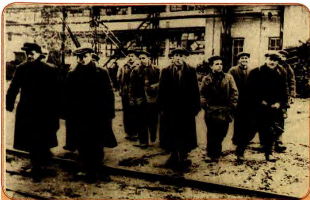
Робітники суднобудівного заводу «Ленінська кузня» повертаються на свої робочі місця. Київ. 1943 р.

Суди над колаборантами здійснювали власті всіх визволених від гітлерівської окупації країн. Співробітництво з нацистами (колаборація) скрізь викликало презирство й ненависть. Але ніде це поняття не тлумачилося так широко, як у СРСР.