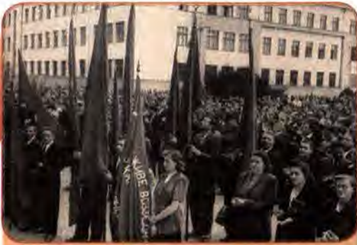
Мітинг з нагоди входження Закарпатської України в єдину УРСР. Ужгород. 8 липня 1945 р.

політичною ситуацією, радянське керівництво взяло курс на приєднання цієї території до складу України. В конкретно-історичній ситуації 1944 р. це відповідало настроям переважної більшості населення краю.