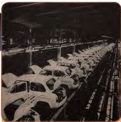
Головний конвеєр складання малолітражних автомобілів. Запоріжжя. 1967 р.

Усе це сприяло забезпеченню високих економічних показників розвитку України. Протягом восьмої п'ятирічки (1966–1970) основні виробничі фонди і загальний обсяг промислового виробництва зросли в 1,5 раза, а національний дохід – на 30 %. Характерно, що дві третини приросту промислової продукції було одержано за рахунок підвищення продуктивності праці.