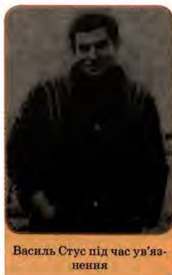
Василь Стус під час ув'язнення

Ці слова написані Василем Стусом – одним з найяскравіших українських поетів ХХ ст. Його двічі арештували. У 1980 р. В. Стуса було засуджено до 10 років позбавлення волі і на 5 років заслання. Відомий російський правозахисник Андрій Сахаров писав: «Вирок Стусові – ганьба радянської репресивної системи». У 1985 р. поет помер в одному з мордовських таборів, проживши сорок сім років. У 1989 р. його прах та прах поета Юрія Литвина і філолога Олексі Тихого перевезено і перепоховано в Києві на Байковому кладовищі. Рішенням Ради Міністрів УРСР В. Стус за поетичну збірку «Дорога болю» посмертно удостоєний звання лауреата Державної премії Української РСР у галузі літератури за 1990 р.