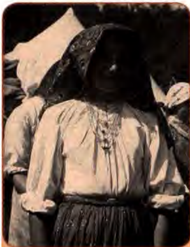
Лемкиня. 1940 рр.

При цьому прикривалися необхідністю ліквідації на цих територіях залишків формувань УПА. Було виселено зі своїх домівок та відправлено на захід Польщі близько 150 тис. осіб. Переїзд та розміщення українців на нових землях стали справжньою