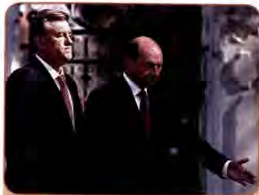
Президент Румунії Траян Басеску вітає Президента України Віктора Ющенка у Бухаресті. 30 жовтня 2007 р.

У контексті підписання українсько-румунського договору 2 червня 1997 р. вирішувалася і доля острова Зміїний на Чорному морі, розташованого за 35