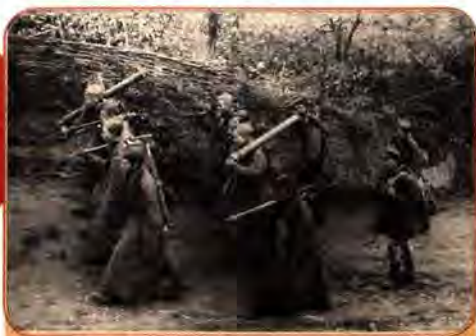
Мінометники 1-го Українського фронту переходять на нову позицію. Букринський плацдарм. 1943 р.

денний фронти відповідно в 1-й, 2-й, 3-й, 4-й Українські фронти.