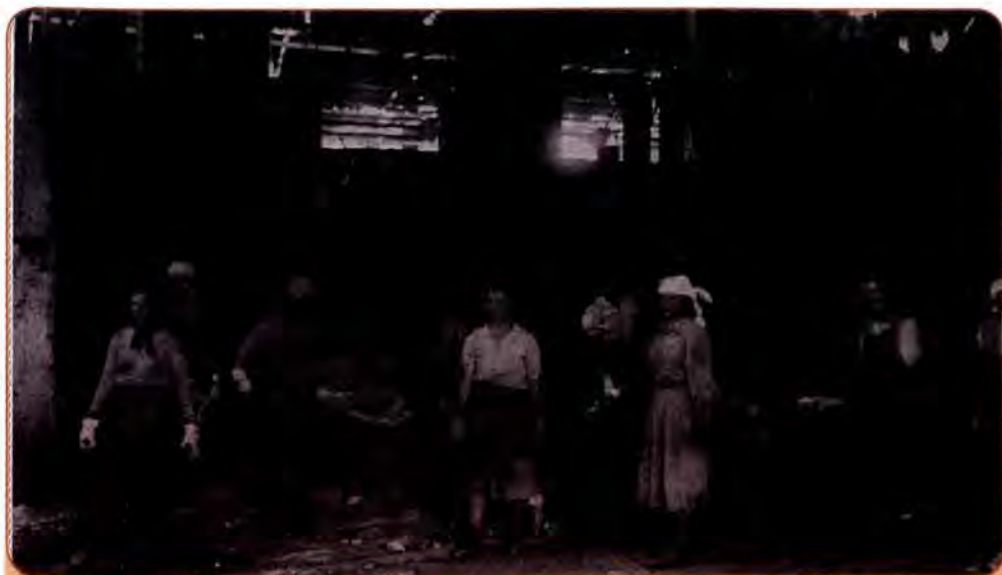
Відбудова мартенівської печі № 5 металургійного заводу ім. К. Ворошилова. Ворошиловград (сучасний Луганськ). 1944 р.

що становило 24 % загальної суми, наданої урядом СРСР на відбудову радянських територій. Що ж до матеріальних збитків, яких зазнала Україна в роки війни, то вони становили 42 % загальних збитків СРСР.