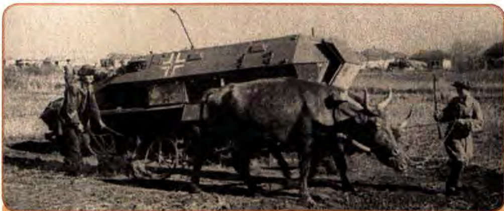
Селянин оре землю в одному із сіл на Ворошиловградщині (сучасна Луганська обл.). 1943 р.

Всього до травня 1945 р. було відбудовано і введено в дію близько 3 тис. великих промислових підприємств України. Промисловий потенціал України працював на забезпечення фронту боєприпасами, бойовою технікою, спорядженням.