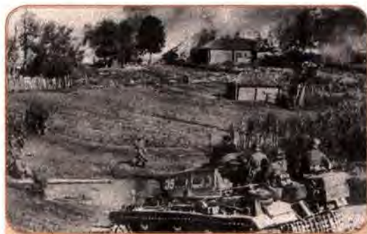
Німецький танк в'їжджає в один з населених пунктів України. Радянські солдати здаються в полон. Жовтень 1941 р.

Позбавлені організованого керівництва, військові масово здавалися в полон. У листопаді 1941 р. у на-