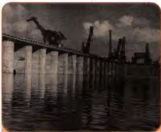
Гребля Каховської ГЕС. Херсонщина. 1955 р.