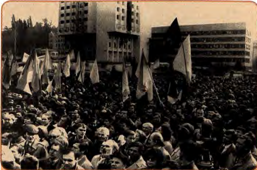
Мітинг «Закону про вибори і закону про мову – демократичну основу». Київ. 1989 р.

1988-й і початок 1989-го років ознаменувалися активізацією політичного життя в країні. Перебудова, яка до цього була справою партійно-державних верхів, викликала рух «знизу», активні дії широких народних мас. Цьому активно сприяла гласність. Союзні, а за ними й республіканські ЗМІ почали публікувати і транслювати інформацію, що раніше була недо-