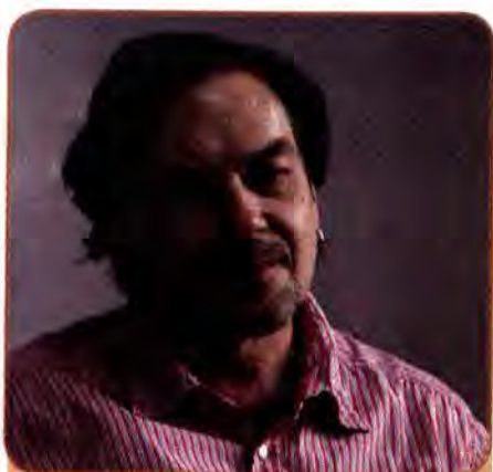
Юрій Андрухович – один із засновників постмодерністської течії в українській літературі