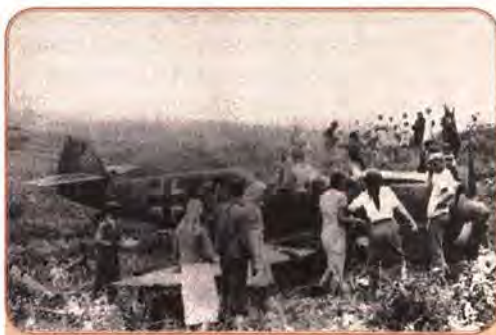
Біля збитого німецького літака. 1941 р.

вузли, знищував склади боєприпасів, пального і продовольства, які, відповідно до радянських намірів «воювати на чужій території», були зосереджені в прикордонній смузі. Німецькі війська забезпечили собі значну перевагу.