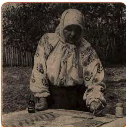
Народна художниця УРСР М. Примаченко (Приймаченко) за роботою. Село Болотня Іванківського району на Київщині. 1969 р.