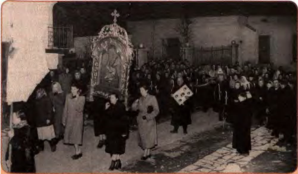
Великий хресний хід, Дрогобиччина (сучасна Львівська обл.). 1958 р.

обласної ради. Ця процедура спрощувалася. Культовий об'єкт міг бути закритий на підставі акта технічної комісії та висновку уповноваженого у справах культів при облвиконкомі. Культові споруди закривали і навіть демонтували «у зв'язку з реконструкцією населених пунктів», як мотивували свої дії власті. Священики позбавлялися можливості контролювати фінанси релігійних громад, не мали права керувати їхньою практичною діяльністю. Державні податки на релігійні громади сягали понад 80 %. Релігійна громада мала право наймати священнослужителя тільки тоді, коли він отримував реєстраційне посвідчення уповноваженого в справах культів при облвиконкомі.