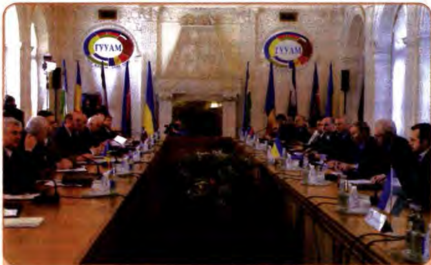
Пленарне засідання глав держав-учасниць ГУУАМ. Ялта, 7 червня 2001 р.

Саме в цьому контексті керівництво України розглядає ідею створення Єдиного економічного простору (ЄЕП) – економічної, а можливо, й політичної інтеграції держав СНД. Про намір створення ЄЕП президенти Росії, Казахстану, Білорусі та України заявили ще 2003 року. Однак коли справа