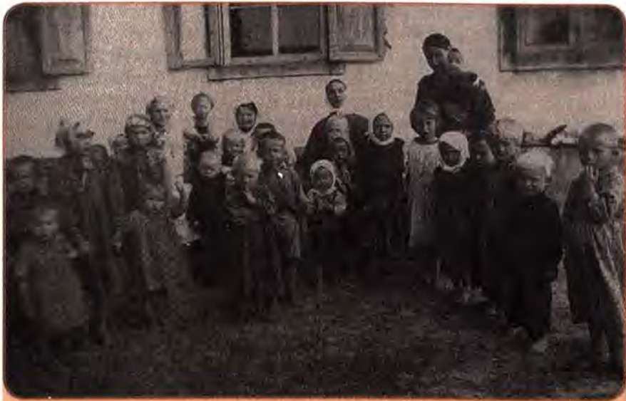
У дитячих яслах колгоспу «Більшовик» на Сумщині. 1952 р.

дукції машинобудування більше, ніж у будь-якій іншій республіці СРСР. Цукор, 70 % виробництва якого зосереджувалося в Україні, дуже рідко потрапляв на стіл трудящих республіки. Те саме було й із соняшниковою олією. Реальні прибутки переважної більшості працівників, як у місті, так і на селі, були нижчими від довоєнного рівня. Нарощування виробництва сільськогосподарської продукції відбувалося меншими темпами, ніж приріст населення, який у післявоєнні роки був значним.