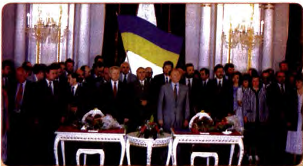
Прийняття Конституції України. Київ, 1996 р.

Паралельно продовжувалася робота над Конституцією, до якої були залучені найкращі фахівці. 11 березня 1996 р. співголови Конституційної комісії – Президент України та Голова Верховної Ради України – підписали проект Конституції. Цей проект Л. Кучма запропонував парламенту прийняти за основу. Але ця пропозиція не пройшла: Верховна Рада направила його на вивчення до постійних комісій парламенту. Це означало, що прийняття нової Конституції знову відкладається на невизначений термін.