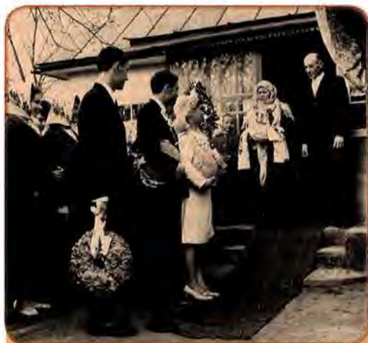
Батьки зустрічають молодих. Село Чернятка Вершадського району на Вінниччині. 1971 р.

Невтішні демографічні зміни відбувалися і в місті, де також зменшувалася народжуваність. Збільшувалася частка малих сімей – без дітей і з однією дитиною: у цілому по Україні в 1960 р. їх було 55,5%, у 1989 р. – 62,0%. Побутова невлаштованість – мільйони молодих людей жили в гуртожитках – заважала створювати сім'ї. Було багато розлучень. Збільшувалася кількість