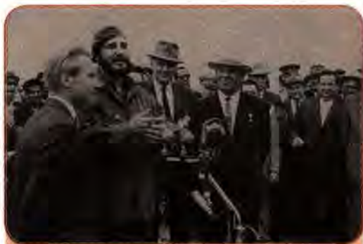
Урядова делегація УРСР зустрічає керівника Куби Ф. Кастро. Київ. 1963 р.

Це був серйозний крок на шляху стримування гонки озброєнь, і навіть формальна причетність до нього України викликала в суспільстві позитивні емоції.