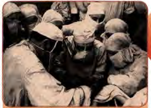
Видатний український хірург В. Філатов під час операції. Одеса. 1946 р.

Завдяки подвижницьким зусиллям видатного українського вченого С. Лебедева, якого влада підозрювала в «буржуазній лженауковості», в Інституті електротехніки АН УРСР було створено лабораторію моделювання та обчислювальної техніки, що започаткувала дослідження в галузі кібернетики. У 1948–1951 рр. тут створюється перша в СРСР мала електронно-обчислювальна машина «МЕОМ».