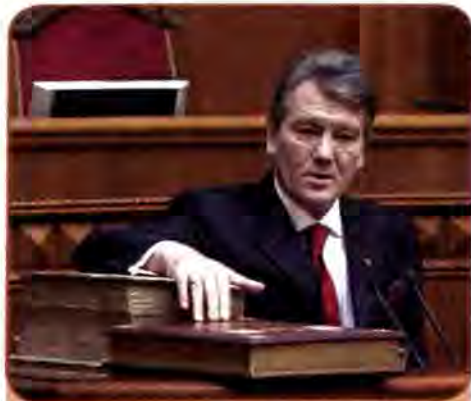
Президент України Віктор Ющенко складає присягу на вірність українському народу. 2005–2010 рр.

Повторне голосування принесло перемогу В. Ющенку. Він одержав 51,99 % голосів, а В. Янукович – 44,2 %. 23 січня 2005 р. у Верховній Раді України та на майдані Незалежності В. Ющенко склав присягу Президента України.