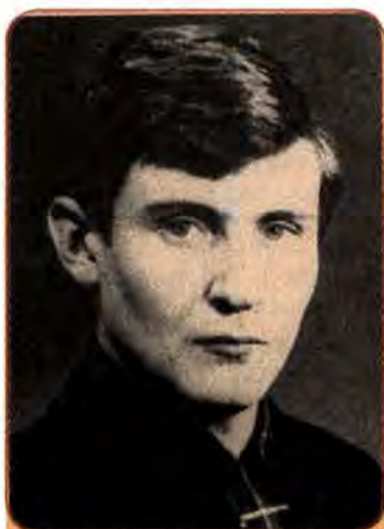
Володимир Івасюк – один з основоположників сучасної української естрадної музики