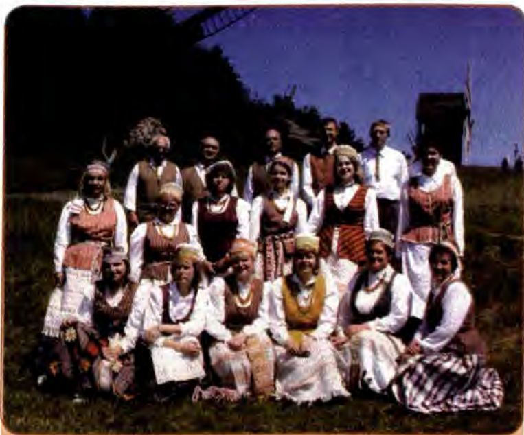
Литовський самодіяльний колектив на святі національних культур у Києві

У прийнятій 1 листопада 1991 р. Верховною Радою Декларації прав національностей України підкреслювалося, що Україна гарантує всім народам, національним групам, громадянам, що проживають на її території, рівні економічні, політичні, соціальні та культурні права.