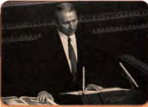
Новообраний Президент України Л. Кучма складає присягу на вірність народові України. Київ. 19 липня 1994 р.

ському народові. Поклавши праву руку на видатну пам'ятку української духовності XVI ст. – Пересопницьке євангеліє, глава держави присягнув дотримуватися Конституції та Законів України, поважати права і свободи людини, захищати суверенітет України, добросовісно виконувати покладені на нього обов'язки.