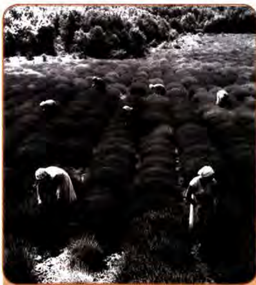
Прополювання лаванди у Мало-Маяцькому радгоспі поблизу Алушти. Крим. 1957 р.

Основою впровадження кукурудзи, яку щедро величали «царицею полів», стали не економічні, а примусові акції. Ставка робилася на партійно-державний апарат, а не на господарську доцільність, не враховувалися властивості ґрунту, клімат та ін. З 1958 до 1963 р. посівні площі, зайняті цією культурою,