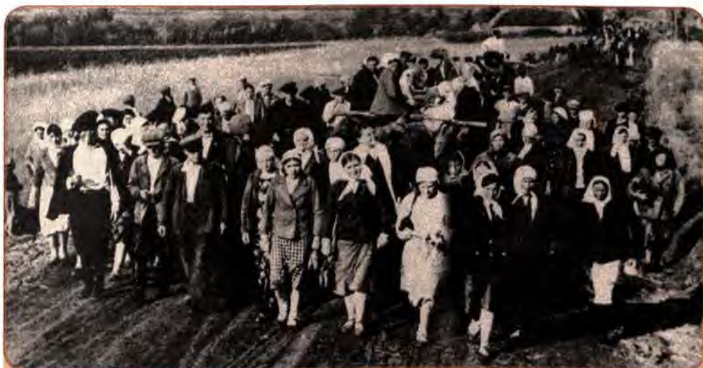
Відправлення радянських громадян на примусові роботи до Німеччини. Черкащина. 1942 р.

цевого населення, які виявили бажання співпрацювати з окупантами: бургомістри в містах, голови в районах, старости в селах, допоміжна поліція, добровольчі військові з'єднання і т.д. Серед жителів України була певна частина антирадянськи налаштованих людей, які без вагань погоджувалися служити окупантам. У сучасній науці співробітництво з нацистською Німеччиною і її союзниками називається колабораціонізмом (від франц. – співробітництво ).