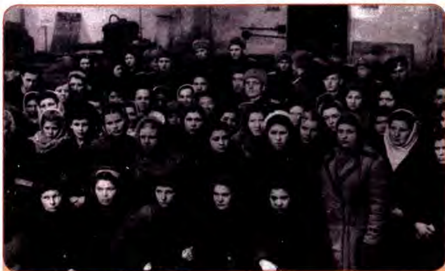
Мітинг на заводі «Арсенал», присвячений грошовій реформі та скасування продовольчих карток. Київ. 1947 р.

дефіцитні, стануть доступнішими. Вважалося, що це станеться вже 1946 р., але у зв'язку з катастрофою в сільському господарстві скасування було перенесено.