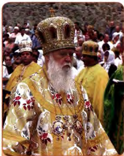
Філарет (Денисенко) – патріарх УПЦ Київського патріархату

При Президенті В. Януковичу влада чітко визначила свою орієнтацію на УПЦ, підпорядковану Московському патріархату.