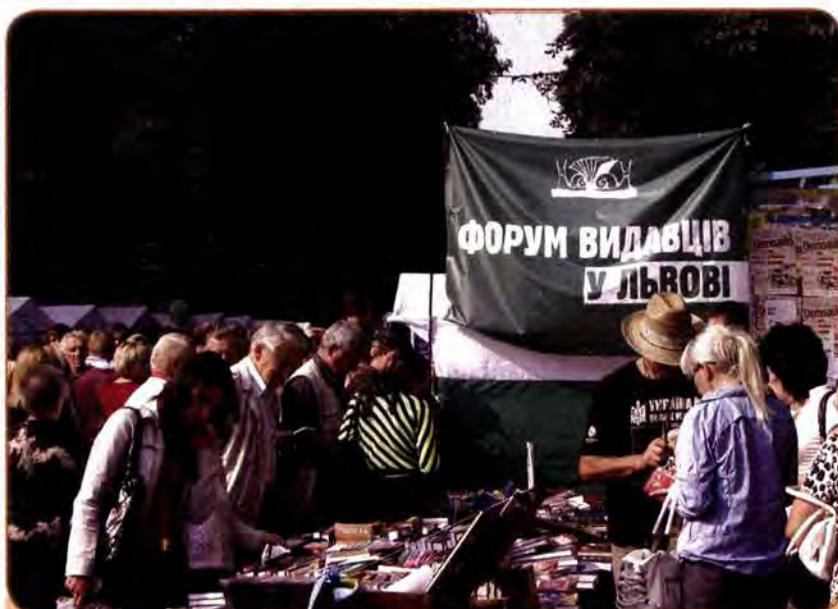
«Форум видавців» – книжковий ярмарок, який щорічно проводиться у Львові