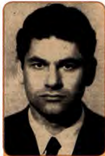
Йосип Тереля – поборник прав української греко-католицької церкви. 1970 рр.

Після 1980 р. арешти тривали. Було заарештовано за звинуваченням в антирадянській