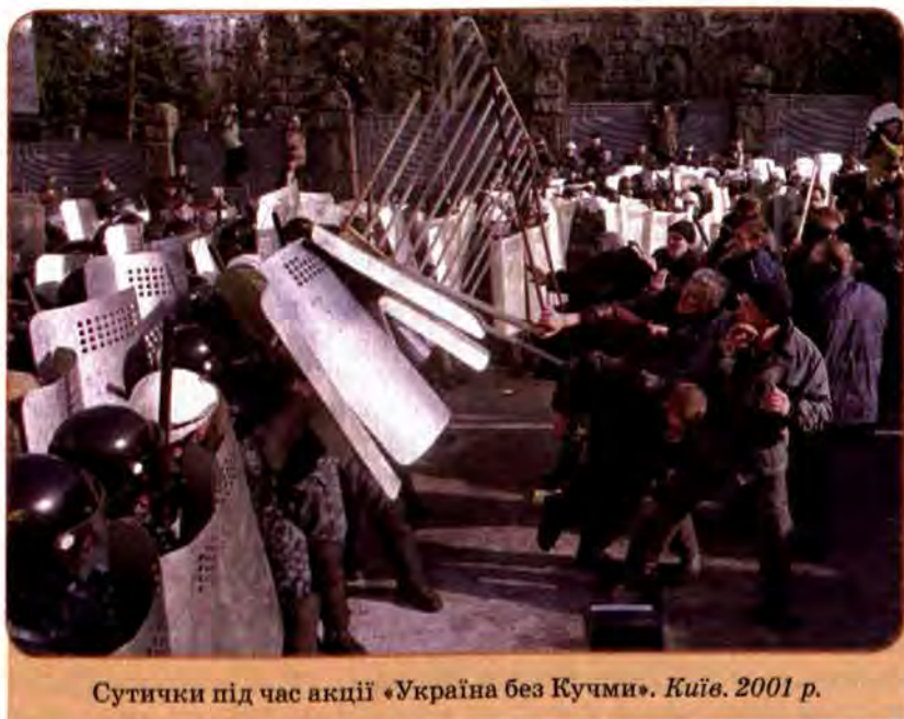
Сутички під час акції «Україна без Кучми». Київ, 2001 р.

Лідером Фронту стала Юлія Тимошенко – молодий політик, яка ще недавно була віце-прем'єром, контролювала питання функціонування паливно-енергетичного комплексу і була звільнена з посади Л. Кучмою. Серед її прихильників поширювалася думка, що Ю. Тимошенко усунули за