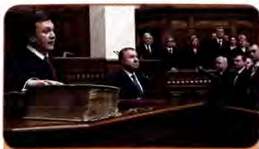
Президент України Віктор Янукович складає присягу на вірність українському народу. Лютий 2010 р.

31 жовтня 2010 р. у відповідності з новим законом відбулися вибори депутатів до місцевих рад і вибори сільських, селищних і міських голів. Україна одержала місцеву владу на 5 наступних років.