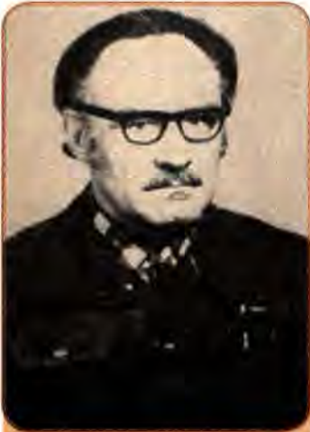
Іван Світличний – український дисидент, літературознавець і поет

Іншою формою діяльності дисидентів стало поширення підготовлених ними книжок, статей, відоєв, що викривали і засуджували політику влади. Ці матеріали потайки переписувалися, передруковувалися, передавалися з рук у руки. Така система поширення інформації називалася «самвидавом» – за іронічним висловом російського дисидента В. Буковського: «Сам пишу, сам цензурую, сам видаю, сам поширюю і сам відсиджую».