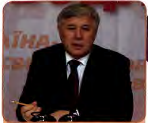
Юрій Єхануров – Прем'єр-міністр України. Вересень 2005 – серпень 2006 р.

Після підрахунку голосів між БЮТ, «Нашою Україною» і Соцпартією було укладено угоду про створення в новому парламенті демократичної коаліції. На звичний для себе пост Голови Верховної Ради претендував О. Мороз – лідер найменшої в коаліції Соціалістичної партії. Ю. Тимошенко заявила, що вважає цілком обґрунтованим для себе претендувати на пост Прем'єр-міністра в коаліційному уряді. Почалися тривалі та виснажливі переговори, в ході яких з'явилися нові претенденти на ці посади з табору