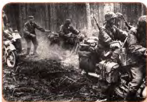
Мотоциклісти Вермахту в лісах Рівненщини. 1941 р.