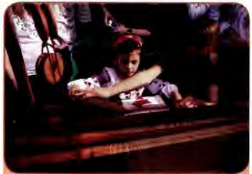
Сучасний етнічний фестиваль «Країна Мрій». 2008 р.

В останні роки, попри скрутне економічне становище, в багатьох колективах фізкультури, спортивних клубах зусиллями адміністрації, профспілкових і фізкультурних організацій почали систематично проводити масові змагання, оздоровчі заходи.