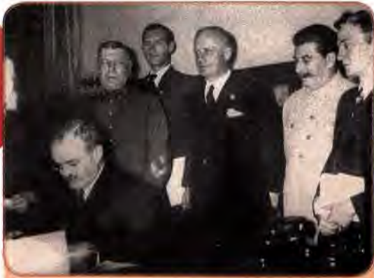
Й. Сталін, Й. Ріббентроп (стоять другий і третій праворуч) і В. Молотов (сидить) під час підписання Договору про ненапад між Німеччиною та Радянським Союзом. Москва. 1939 р.

ної лінії сталінського керівництва СРСР. Жодного впливу не мала вона й на зміну зовнішньополітичного курсу радянського керівництва, яке після багатьох років антифашистської пропаганди раптом наприкінці серпня 1939 р. несподівано пішло на зближення з Німеччиною.