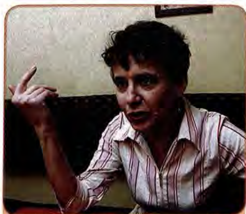
Оксана Забужко – яскрава представниця української сучасної жіночої прози

сучасні українські автори все частіше звертаються до новітніх естетичних форм: відмовляючись від традиційних і модерних підходів, вони опановують постмодерні. Серед прихильників цих форм – Юрій Андрухович, В'ячеслав Медвідь, Олександр Ірванець та ін. Літературний авангард особливо яскраво проявляється в сучасній літературі (твори Юрія Андруховича, Віктора Неборака, Івана Андрусяка та інших).