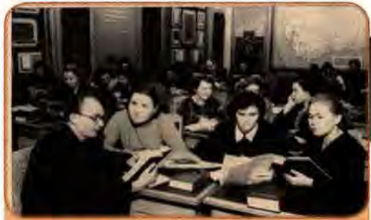
Студенти Одеського державного університету ім. І. Мечнікова готуються до сесії. 6 травня 1955 р.

Колектив Науково-дослідного конструкторсько-технологічного інсти-