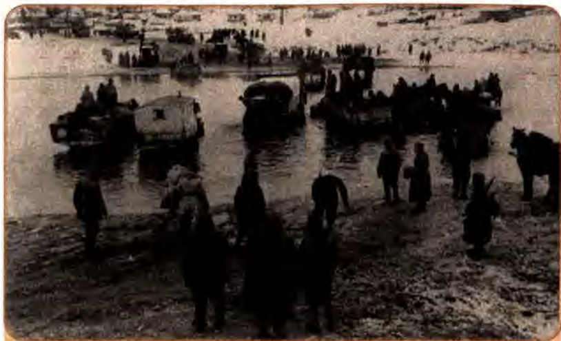
Механізовані частини 1-го Українського фронту форсують річку Тетерів неподалік від м. Коростишів на Житомирщині. 1944 р.

24 січня в напрямку Шпола–Звенигородка почав наступ 2-й Український фронт. Наступного дня назустріч йому рушило ударне угруповання 1-го Українського фронту. Долаючи відчайдушний опір, війська просувалися вперед, доки, нарешті, не з'єдналися 28 січня в районі Звенигородки. В оточенні опинилося близько 80 тис. гітлерівців. Їхнє становище було безнадійним. 8 лютого радянське командування висунуло їм ультиматум про негайну капітуляцію. Після відмови німців здатися війська почали операції зі знищення оточених. Було вбито і поранено 55 тис. солдатів і офіцерів, 18 тис. потрапили в полон.