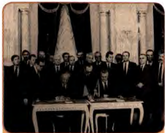
Голови Верховних Рад УРСР та РРФСР Л. Кравчук і Б. Єльцин підписують договір між двома республіками. Київ, 1990 р.

У лютому 1989 р. завершився вивід радянських військ з Афганістану, а «неоголошена війна» в цій країні, у ході якої загинуло понад 15 тис. радянських громадян, у т.ч. 2378 вихідців України, II з'їздом народних депутатів СРСР була визнана політичною помилкою.