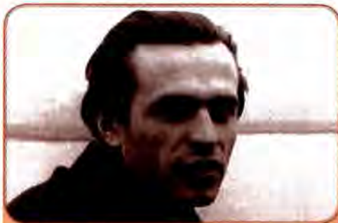
Василь Симоненко – український поет, прозаїк, журналіст, «лицар українського відродження». 1960 рр.

Стрімко увірвалася в українську поезію одна з найобдарованіших представниць «шістдесятників» Ліна Костенко. З відзнакою закінчивши Літературний інститут ім. Горького в Москві, поетеса випускає дві одразу ж помічені критикою збірки поезій – «Проміння землі» та «Мандрівки серця». Ліна Костенко звертається до вічних проблем духовності українського народу, історичного минулого країни. Вірші поетеси вирізняються неординарністю, критичною оцінкою багатьох подій.