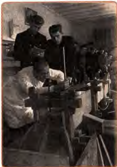
Студенти гідротехнічного інституту в лабораторії. Одеса. 1951 р.

ліну, оголошувалося найвищим, найважливішим покликанням школи.