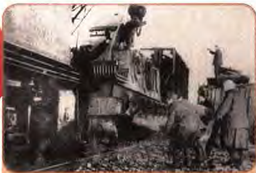
Евакуація заводського обладнання. Запоріжжя. 1941 р.

кладів, державних установ, людей. Раду з евакуації, організовану ЦК ВКП(б) і Раднаркомом СРСР, очолив М. Шверник. В Україні евакуацією керувала комісія на чолі із заступником голови РНК УРСР Д. Жилою. На схід виїхало понад 3,8 млн робітників, селян і службовців. На нових місцях вони включалися в роботу на оборонних підприємствах, у сільському господарстві, в установах.