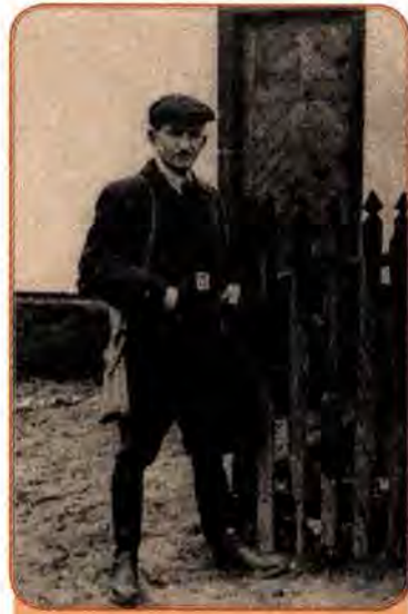
Головний командир УПА Роман Шухевич. Друга половина 1940-х рр.

Однак і на цьому боротьба не закінчилася. Окремі оунівські групи були викриті лише в 60-ті роки. Таке тривале їх існування було неможливе без певної підтримки населення. Це свідчить, що радянська заохочувальна політика в західних областях України відбувалася досить повільно. Було чимало випадків, коли ідеями незалежності України, які пропагували повстанці і підпільники, переймалися вихідці з Наддніпрянщини, які з тих чи інших причин опинялися в Західній Україні: вчителі, медпрацівники, червоноармійці (навіть офіцери), селяни (що під час голоду 1946–1947 рр. масово приїжджали до Галичини).