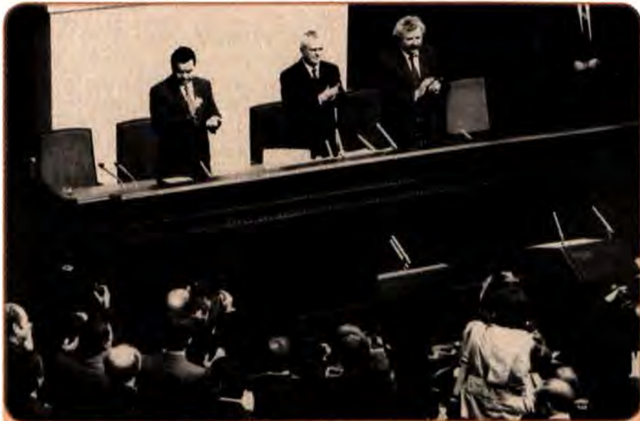
Президія Верховної Ради після ухвалення Акта проголошення незалежності України. Зліва направо: І. Плющ, Л. Кравчук, В. Гриньов. Київ, 24 серпня 1991 р.

Отже, 24 серпня 1991 р. перестала існувати Українська Радянська Соціалістична Республіка. На політичній карті світу з'явилася нова незалежна держава – Україна.