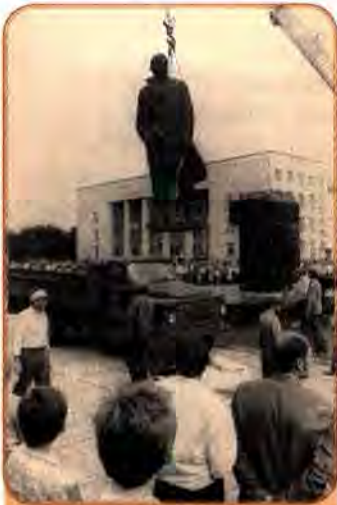
Демонтаж пам'ятника В. Леніну в м. Червоно- граді на Львівщині. 1990 р.

Склалися умови, за яких зближувались інтереси різних соціальних груп українського населення, і на перший план виступало прагнення до суверенітету республіки. Українська партійно-державна номенклатура прагнула самостійності у розв'язанні питань з управління територією; українське селянство, повернувшись обличчям до свого минулого – колективізації, депортацій і голодоморів, безпосередньо пов'язувало це з політикою Москви. Робітники також все більше пов'язували надії на покращення свого становища з розширення прав України. І нарешті, українська інтелігенція, представники дисидентства в досягненні незалежності вбачали здійснення віковичної мрії українського народу.