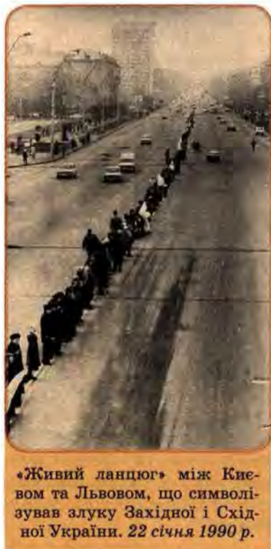
«Живий ланцюг» між Києвом та Львовом, що символізував злуку Західної і Східної України. 22 січня 1990 р.

Місцеві організації Компартії України опинилися в цих областях у незвичній для себе ролі опозиційних. Над багатьма містами й селами України замайорили блакитно-жовті національні прапори.