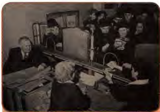
Київці обмінюють старі гроші на нові. 1961 р.

Через західну культуру, фільми, кінофестивалі, виставки тощо в міста проникають нові віяння моди. У другій половині 50-х років у містах з'явилися молоді люди, які своїм одягом, зачіскою і манерою поведінки копіювали героїв західних кінофільмів. Їх називали «стилягами» і звинувачували в низькопоклонстві перед Заходом. Але з часом до них звикли. Населення, особливо молодь, прагнули одягатися різноманітніше, сучасніше. Дедалі частіше звер-