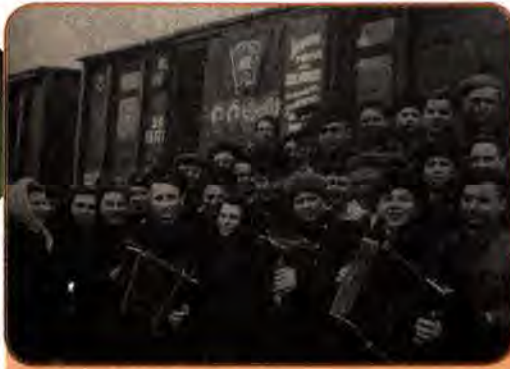
Від'їзд молоді на будівництво залізниці Кустанай–Золота Сопка в Казахстані. Київський вокзал. 1955 р.

цілинних та перелогових земель багато писали в газетах, журналах, велися передачі на радіо. У Казахстан і на Алтай з України виїхало понад 100 тис. чоловік, переважно молоді. Частина з них пізніше повернулася додому, інші залишилися працювати в створених там зернових радгоспах, до яких активно надсилалася техніка. Лише 1955 р. з України було відправлено близько 11,4 тис. тракторів і 8,5 тис. комбайнів. Вони й заклали основу технічної бази новоорганізованих господарств.