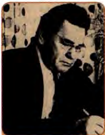
Микола Руденко – український дисидент, керівник УГГ, поет і прозаїк

У декларації проголошувалося, що в своїй роботі Група керується не політичними, а лише гуманітарно-правовими мотивами і своєю головною