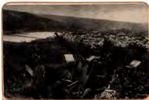
Охорона мосту через річку Дністер на Тернопільщині. 1944 р.

Розгром нацистських військ у Криму викликав хвилю піднесення в місцевого населення, але досить швидко її заступили заціпеніння і жах. Усе кримськотатарське населення було звинувачене в співробітництві з окупантами і за рішенням Державного комітету оборони у травні 1944 р. виселене в Середню Азію. Із загальної кількості (238,5 тис. осіб)