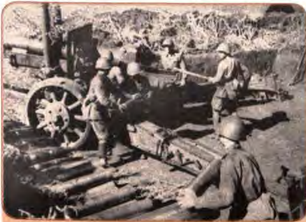
Артилеристи обороняють о. Хортиця. Запоріжжя. 1941 р.