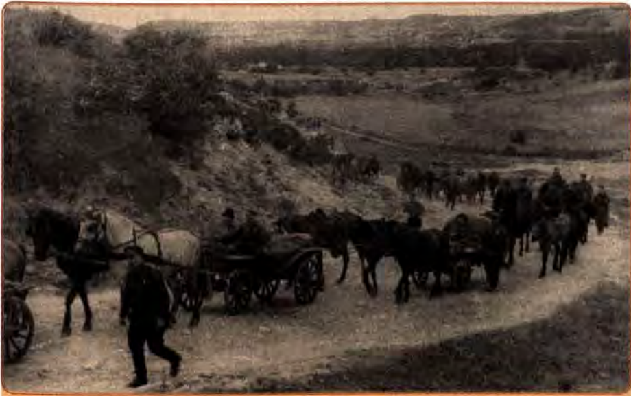
Ковпаківці на марші. Карпати. 1943 р.

армія одержала 1260 агентурних донесень. Боротьба радянських партизанів і підпільників у тилу німецьких військ була важливим фактором, що забезпечував успішне просування Червоної армії. За підрахунками сучасних істориків, загальна кількість осіб, які перебували у різні роки війни в партизанах і підпіллі в Україні, становила приблизно 180–220 тис. осіб. 29 учасників радянського підпілля і партизанського руху відзначені званням Героя Радянського Союзу.