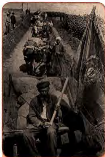
Трудівники колгоспу ім. Т.Г. Шевченка на Київщині везуть здавати зібраний урожай. 1944 р.

Значних успіхів удалося досягти у відбудові основних галузей народного господарства. На кінець війни питома вага Донбасу в загальносоюзному видобутку вугілля зростає до 26,7 %. У 1945 р. Україна дала 18 % загальносоюзного виробництва чавуну і 11,2 % сталі.