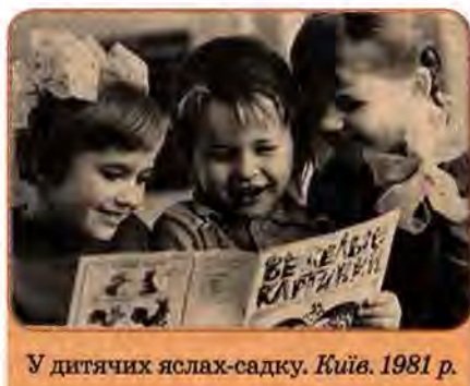
У дитячих яслах-садку. Київ. 1981 р.

Істотні зміни почали відбуватися у складі працездатних. Їхня частка в населенні зменшилася протягом 1959–1989 рр. з 59,5 % до 55,8%. Одночасно – з 13,5 до 21,2 % – збільшився відсоток осіб пенсійного віку. Це більше ніж у будь-якій іншій республіці СРСР.