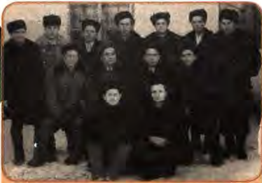
Спецпоселення із Західної України в с. Котинівка. Іркутська обл. (нині РФ). 1956 р.

То вже був третій етап реабілітації (перший – 1953 р., другий – 1954–1955 рр.). Змінився й порядок проведення цієї акції. За пропозицією М. Хрущова було створено 90 спеціальних комісій, що мали право розглядати справи безпосередньо в таборах ув'язнення. До їхнього складу входили працівники прокуратури, представники апарату ЦК КПРС і вже реабілітовані члени партії. Комісіям тимчасово надавалися права Президії Верховної Ради в справі реабілітації, помилування, зменшення терміну ув'язнення, перегляду статей звинувачення.