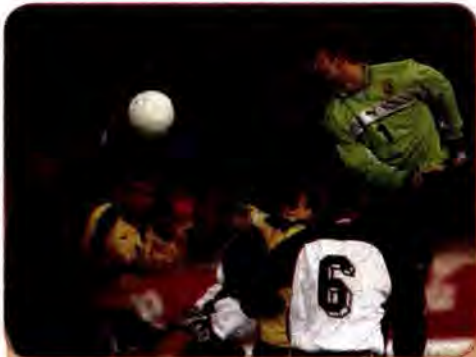
Епізод відбіркового матчу чемпіонату Європи між футбольними збірними командами України та Словенії. Київ. 17 листопада 1999 р.

23 нагороди (зокрема 9 золотих), посіли 9-те місце серед 194 країн-учасниць. І хоча цей результат на наступних олімпіадах повторити не вдалося, інформація про досягнення українських атлетів не сходила зі шпальт газет. Спортивну славу України відстоюють кращі боксери-важковики світу брати Віталій і Володимир Клички. Видатні спортивні результати продемонстрували С. Бубка (стрибки з жердиною), О. Зубрилова (біатлон), О. Вітриченко (художня гімнастика), Е. Тедеев (вільна боротьба), І. Разорьонов (важка атлетика), Д. Силантьєв (плавання), С. Голубицький (фехтування на рапірах), О. Жупіна (стрибки у воду), І. Добрянська (легка атлетика), А. Вар-