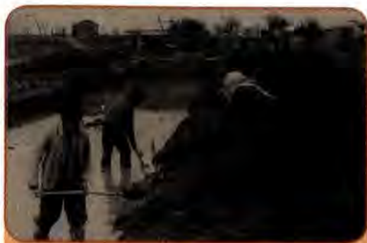
Будівництво зрошувальної системи в колгоспі ім. Жовтневої революції на Одещині. 1949 р.

Успішна відбудова електроенергетики й вугільних шахт Донбасу сприяла відродженню металургійної та інших базових галузей народного господарства України. Наприкінці п'ятирічки видобуток залізної руди і виробництво прокату чорних металів перевищили рівень 1940 р. Ціною