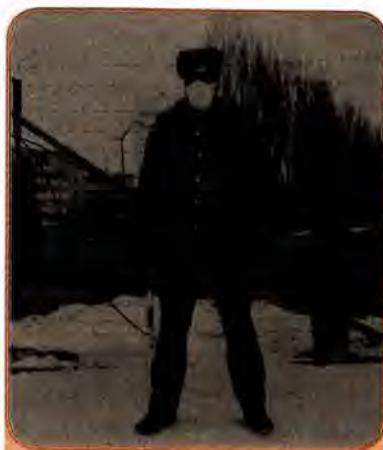
Міліцейський пост перед в'їздом у Чорнобиль. 1986 р.

Усім було відомо, що впродовж десятиліть наступ загальносоюзних чиновників на українську культуру відбувався за сприяння тієї ж Компартії України, яка за будь-яку ціну прагнула продемонструвати центрові свій