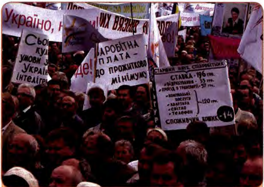
На мітингу «Повстань, Україно!» на Європейській площі в Києві. 2002 р.

Як відомо, з пропозиціями утвердити в Україні парламентсько-президентську (чи навіть парламентську) модель постійно виступали ліві партії. Але в конкретній ситуації літа 2003 р. вони зустріли проект Президента в багнети: більшості у них у Верховній Раді вже не було, а відтак не було і надій на проведення в новому форматі влади своєї політичної лінії. До того ж після «касетного скандалу» довіра до Л. Кучми була повністю втрачена. Владу звинувачували в неефективній економічній політиці, яка призводить до зубожіння мас, масштабній корупції, кричущому порушенні свободи слова, заангажованості судової системи. Було ще одне серйозне обвинувачення: Л. Кучма не вірить у перемогу на майбутніх виборах провладного кандидата і хоче залишити своєму наступнику, яким буде представник опозиції, мінімум повноважень.