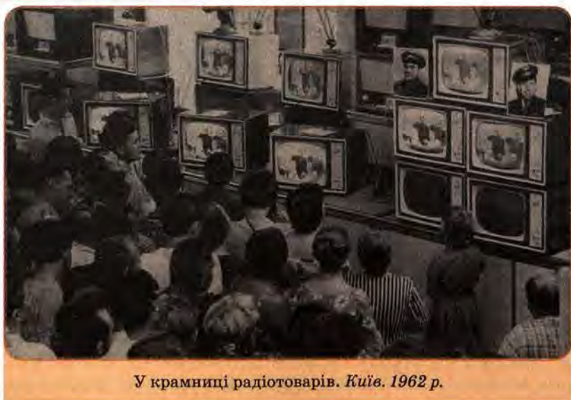
У крамниці радіотоварів. Київ. 1962 р.

талися в ательє або шили дома за лекалами. Кому «пощастило» і в кого були кошти, у перекупщиків («спекулянтів») купували іноземне. У моду стала входити косметика. Промисловість поступово налагоджувала масовий випуск нейлонових сорочок, капронових панчіх і шкарпеток із синтетики. Щоправда, аби їх придбати, необхідно було кілька годин простояти в черзі.