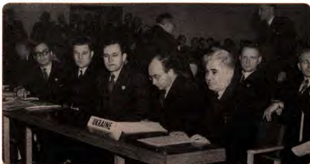
Члени делегації УРСР на Першій сесії Генеральної Асамблеї ООН. Лондон. 1946 р.

ками Німеччини і поставила свій підпис під мирними договорами з Болгарією, Італією, Румунією, Угорщиною, Фінляндією. З іншого боку, договори про польсько-радянський кордон і Закарпатську Україну СРСР підписував без участі УРСР.