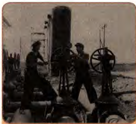
На будівництві газопроводу Дніпропетровськ-Кривий Ріг. 1959 р.

На середину 60-х років питома вага машинобудування в загальному обсязі промислового виробництва зросла до 25 %. У цей час у республіці з'явилася нова галузь промисловості – легкове автомобілебудування (Запоріжжя). Розпочався випуск найбільших у світі суховантажних суден та риболовецьких траулерів у Миколаєві. Значних успіхів досягло авіабудування – було налагоджено випуск нових типів пасажирських і транспортних літаків високого класу. З 1960 р. завдяки творчому співробітництву авіабудівників Києва і моторобудівників Запоріжжя розпочато виробництво реактивних повітряних лайнерів Ту-124.