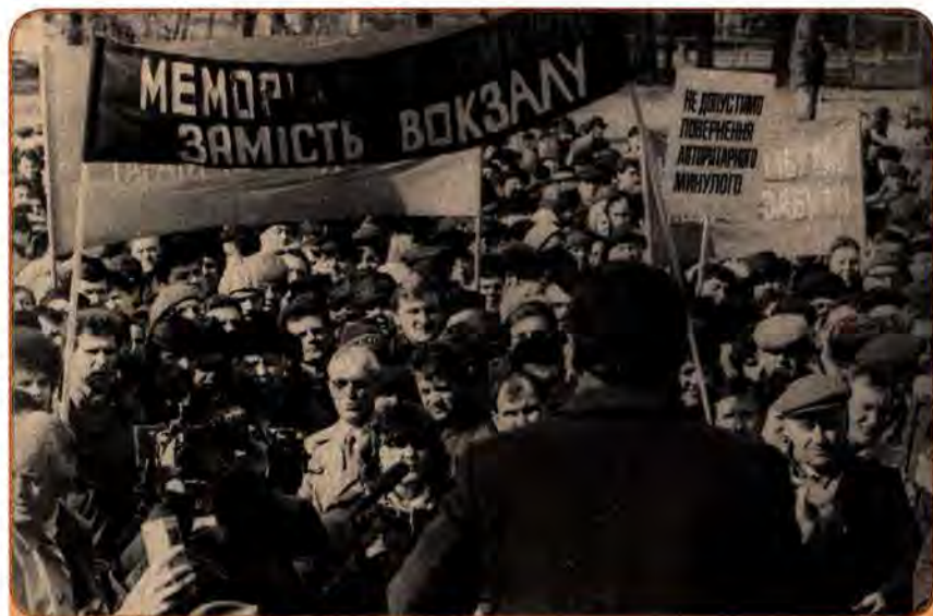
Мітинг, присвячений створенню в Україні історико-просвітницького товариства «Меморіал». Київ. 1989 р.

У травні 1989 р. на хвилі розвінчування культу особи Й. Сталіна у Києві відбувся установчий з'їзд Українського історико-просвітницького товариства «Меморіал» . Приїхало близько 500 делегатів, які представляли 70 міських і багато сільських об'єднань. На з'їзді ухвалено рішення про необхідність активізації роботи щодо реабілітації жертв політичних репресій, вшанування та повернення пам'яті про невинно репресованих, привернення уваги до білих плям української історії, перегляд місця й ролі в ній окремих постатей та подолання комуністичних стереотипів. Зверталася увага на необхідність ліквідації топонімів з прізвищами людей, які зганьбили себе причетністю до масових репресій та поновлення історичних назв. Резолюції конференції «Меморіалу» були підтримані учасниками багатотисячного мітингу, який відбувся 5 березня 1989 р. під гаслом «Ніхто не забутий, ніщо не забуте».