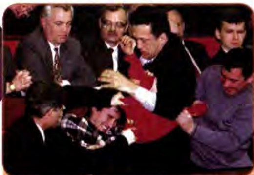
Прихильники правих фракцій у Верховній Раді видирають червоний прапор з рук своїх опонентів. Київ. 8 лютого 2000 р.

вести у квітні 2000 р. референдум, у ході якого народ повинен був висловити свою думку щодо надання Президенту права розпустити Верховну Раду, якщо в ній не буде сформовано депутатську більшість чи вона своєчасно не прийме Державний бюджет (у діючій Конституції права на розпуск парламенту Президентом взагалі не було передбачено), скасування депутатської недоторканності та скорочення числа депутатів парламенту з 450 до 300 осіб. Без таких змін, переконували Л. Кучма і його оточення, необхідні для подальшого розвитку України ринкові реформи провести буде неможливо.