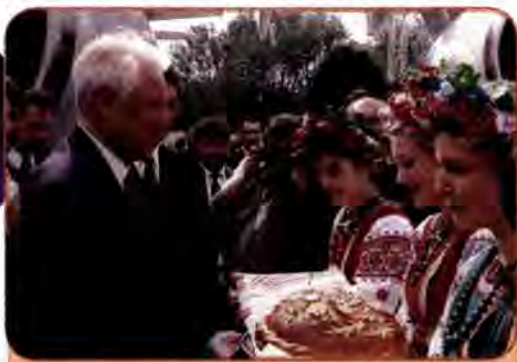
Державний візит в Україну Президента РФ Б. Єльцина. Київ. 1997 р.

основі принципів взаємної поваги та суверенної рівності, територіальної цілісності, непорушності кордонів та інших загальноприйнятих принципів міжнародного життя. Договір було укладено на 10 років.