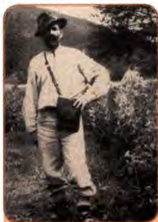
Гуцул. Станіславська (сучасна Івано-Франківська) обл. 1946 р.

У 1946 р. з 16 129 номенклатурних посад у західних областях України місцеві жителі обіймали лише 2097, тобто 13 %. Більшовицький центр їм не довіряв і керував краєм з допомогою вимуштруваних на сході, але чужих місцевому населенню кадрів. По суті це була колоніальна адміністрація.