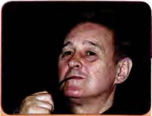
Роман Віктюк – талановитий режисер, відомий своїми епатажними постановками

Різні естетичні напрями доповнюють один одного, створюючи оригінальну, неповторну палітру сучасного українського живопису.