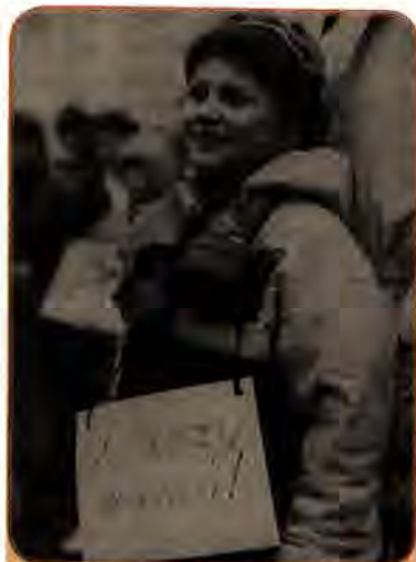
Юна учасниця мітингу на захист навколишнього середовища. Київ. 1986 р.

Виникало багато запитань, на які всі шукали відповіді. Ядерна катастрофа відкрила мільйонам українців очі на колоніальне по суті становище їх республіки. Наслідки трагедії стосувалися усіх жителів України незалежно від соціального статусу, професії, політичних поглядів, національності, віку і статі. Поняття «Чорнобиль» стало алегорією. Заговорили про «духовний Чорнобиль», «мовний Чорнобиль», «культурний Чорнобиль» і т. ін. Питання про Чорнобиль перетворилося на одне із центральних в протистоянні українських опозиційних сил з комуністичним