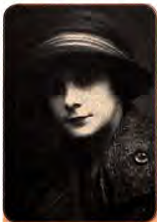
Олена Теліга – видатна українська поетеса, політичний діяч

художники, актори, котрі опинились у гітлерівському тилу, боролися проти окупантів як у складі партизанських з'єднань, підпорядкованих Москві, так і в загонах УПА. В окупованому гітлерівцями Києві група письменників, членів ОУН, на чолі з Оленою Телігою зорганізувалася в Спілку українських письменників. О. Теліга готувала альманах української поезії «Литаври». Разом з іншими членами оунівського підпілля її розстріляли 21 лютого 1942 р. у Бабиному Яру.