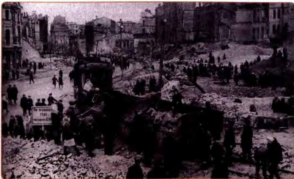
Київ на відбудові вулиці Хрещатик. 1944 р.

За роки війни Україна втратила 8 млн осіб – п'яту частину населення: 2,5 млн осіб загинули в боях, 5,5 млн становили знищені військовополонені й цивільні особи. Якщо ж взяти всі демографічні втрати (крім убитих, вони включають померлих від хвороб і голоду, депортованих, мобілізованих, емігрантів, втрати в природному прирості), то вони обчислювалися неймовірно великою цифрою – 14,5 млн. В 1945 р. в Україні залишилося 27,4 млн людей, тоді як у 1941 р. їх було близько 42 млн.