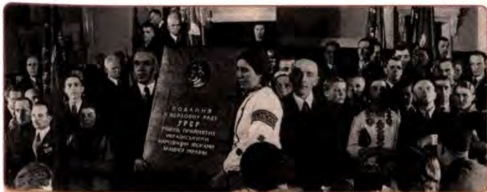
Делегация Західної України на III позачерговій сесії Верховної Ради УРСР. Київ. 1939 р.

Вводилося безкоштовне медичне обслуговування. Це особливо імпонувало сільському населенню, яке здебільшого взагалі не знало, що таке стаціонарна медична допомога. Симпатії до нової влади збереглися навіть попри її наміри здійснити докорінну ломку старих, заснованих на приватній власності й ринкових відносинах, економічних структур. Річ у тому, що спершу перетворення в економіці мало торкалися інтересів українського населення, бо промисловість, торгівля та велике землеволодіння перебували в основному