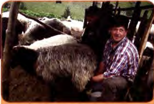
Відродження давньої галузі сільського господарства – вівчарства. Закарпаття

що було звичайним явищем у колгоспах та радгоспах. Факти свідчать, що, використовуючи у 1994 р. лише 1,6 % площі земельних угідь, фермерські господарства виробляли стільки, скільки виробляла середня область України. Водночас поширеним явищем стало отримання землі для заняття фермерством керівниками господарств та наближеними до них особами. Разом із кращими угіддями вони на вигідних умовах скуповували колгоспну та радгоспну техніку.