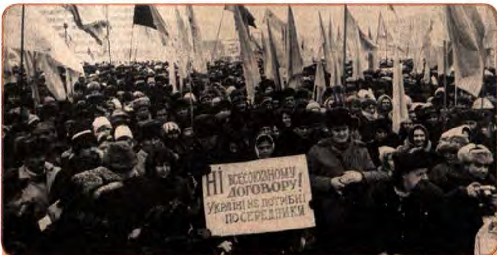
Демонстрація проти підписання керівництвом УРСР нового союзного договору. Київ. 1990 р.

їни. Він суттєво обмежував права республіки та знову передбачав формування союзних органів влади з великими повноваженнями у сфері міжнародних зносин, фінансової політики, передбачав повернення до норми щодо верховенства союзних законів над республіканськими.