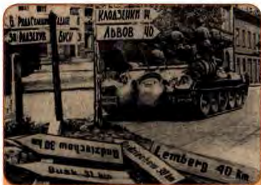
Радянські війська на вулицях одного з населених пунктів Львівської обл. 1944 р.

Останній населений пункт УРСР в її довоєнних межах – село Лавочне Дрогобицької області – визволили від гітлерівців 8 жовтня 1944 р. Офіційним днем завершення вигнання військ Німеччини та її союзників вважається 14 жовтня 1944 р., коли відбулось урочисте засідання в Києві. Що ж до Закарпатської України, то війська 4-го Українського фронту завершили її звільнення від гітлерівців 28 жовтня 1944 р.