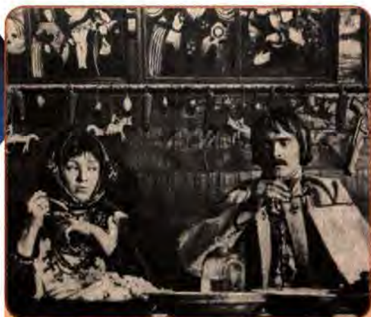
Іван Миколайчук і Тетяна Бестаєва в кінофільмі С. Параджанова «Тіні забутих предків». 1964 р.

У 1980–1982 рр., вперше за довгі роки Державний академічний оперний театр України брав участь у знаменитому Вісбаденському фестивалі. Світ полонили елементи «незнайомої козацької екзотики», високий рівень акторського виконання майстрів сцени в опері «Тарас Бульба» М. Лисенка.