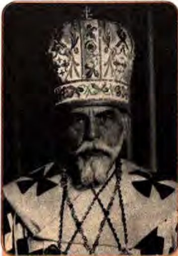
Йосип Сліпий – митрополит греко-католицької церкви в Галичині, який відмовився перейти в російське православ'я

оунівцям. На жорстокість чекістів ОУН відповідала терором, широко використовуючи методи НКВС. Підрозділи Служби безпеки (СБ) УПА, зі свого боку, засиляли псевдоєнкаведистів для виявлення прибічників радянської влади і законспірованих чекістів. Усе це тільки розпалювало взаємну ворожнечу, ненависть, непримиренність у суспільстві.