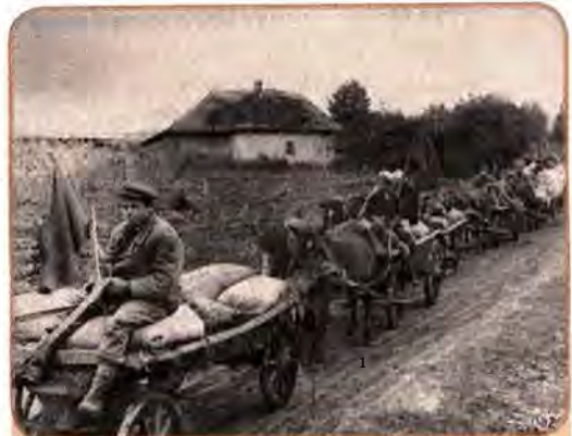
Трудівники колгоспу «Червоний шлях» везуть зерно на приймальний пункт. Чернігівщина. 1940 р.

Весь комплекс адміністративних, економічних і політичних заходів радянського керівництва в 1939–1941 рр. спрямовувався на підготовку до війни. Був створений колосальний воєнно-технічний потенціал. Стояло питання, чи грамотно радянське керівництво скористається ним. Що не все благополучно, продемонструвала радянсько-фінська війна (30 листопада 1939 – 12 березня 1940 р.) . Величезна Червона армія виявилася нездатною розгромити невелику фінську армію. Фінляндія збе-