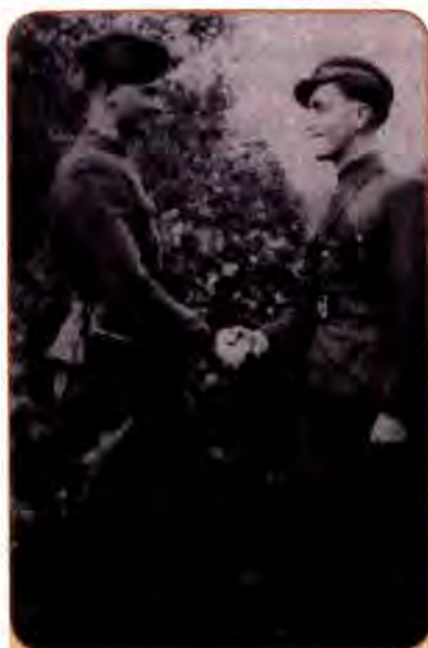
Командири УПА «Чорнота» (ліворуч) і «Чорний». Західна Україна. 1940-ві рр.

Антигітлерівський рух Опору існував в усіх окупованих країнах Європи. Але майже скрізь він, крім внутрішньої підтримки населення, спирався на надійну зовнішню підтримку (еміграційні уряди і держави антигітлерівської коаліції). Український національний рух Опору зовнішньої підтримки не мав. Англія, США, зв'язані з СРСР союзними зобов'язаннями, навіть