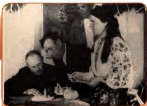
Трудівники колгоспу ім. М. Щорса на Київщині підписуються на державну позику. 1948 р.

Одним із джерел фінансування відбудови були державні позики у населення, які проводилися щорічно фактично у примусовому порядку.