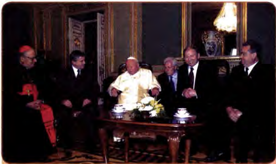
Зустріч Президента України Л. Кучми та інших офіційних осіб з Папою Римським Іоанном Павлом II. Київ. Червень 2001 р.

між Ватиканом і Москвою та лібералізацію релігійного життя в СРСР, радянський уряд та, особливо, Московський патріархат всіяко перешкоджали відродженню УГКЦ. Лише в грудні 1989 р., після зустрічі М. Горбачова з Іоанном Павлом II та численних багатолюдних демонстрацій непокори, в західних областях України намітилися певні зрушення в напрямі легалізації Української греко-католицької церкви. У квітні 1990 р. на вимогу УГКЦ Львівська міська рада передала католикам собор Святого Юра. Визнаним лідером церкви виступив єпископ Мирослав-Іван кардинал Любачівський.