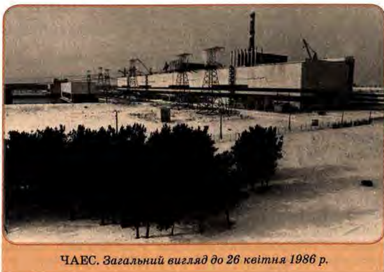
ЧАЕС. Загальний вигляд до 26 квітня 1986 р.

брали участь в ліквідації катастрофи (ліквідатори), стали інвалідами, 7 тис. померли. В районі катастрофи з'явилася 30-кілометрова «зона відчуження», звідки жителів було переселено в інші регіони республіки. Лише прямі втрати України, яка мусила майже повністю взяти на себе справу ліквідації катастрофи на електростанції, що підпорядковувалася свого часу союзному відомству, становили в 1988–1990 рр. у тодішньому масштабі цін понад 20 млрд крб. Та це не вирішило проблеми, і ще довго Україна змушена буде виділяти мільярди на ліквідацію наслідків Чорнобиля, захист тих, хто від нього постраждав.