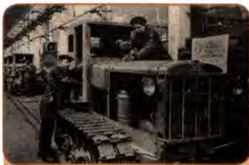
Складання трактора на заводі ім. С. Орджонікідзе. Харків. 1946 р.

Країни, які постраждали у війні, зокрема Німеччина, Японія, держави Західної Європи, відбудову здійснювали в умовах ринкової економіки, приватної власності, конкуренції, співпраці та інтеграції з іншими країнами світу. Нарешті, вони одержали щедрі допомоги США за «планом Маршалла». Нічого цього не було в СРСР. Відмові від ринкових механізмів навіть шукали теоретичне обґрунтування. У брошурі «Економічні проблеми соціалізму в СРСР» Сталін намагався переконати, що товарний обіг гальмує розвиток радянського суспільства. Доводилося, що ефективніше – натуралізація відносин в економіці, перехід до прямого продуктообміну без посередництва грошового еквівалента. Натомість утверджувався планово-командний тиск держави на трудящих, «ножиці» цін на промислову та сільськогосподарську продукцію. Усе диктувалося згори, вимагало безумовного виконання, а той, хто з якихось поважних причин не міг виконати завдання, підлягав осуду, оголошувався саботажником.