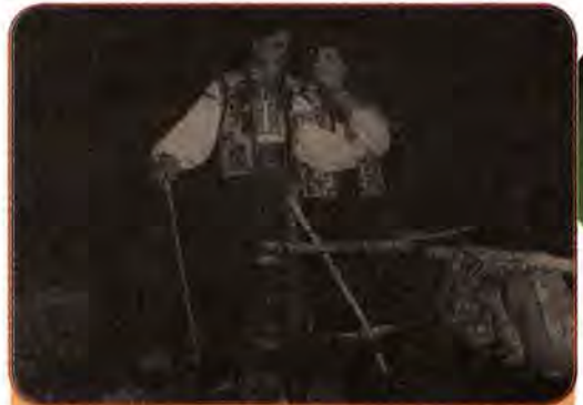
Сцена з опери Г. Майбороди «Мілана» в постановці Київського театру опери та балету ім. Т. Шевченка. 1951 р.

Таким чином, українська культура скористалася новими можливостями, які виникли в умовах десталінізації суспільства. Але вийти за рамки, поставлені для неї партійно-радянським керівництвом СРСР, вона була неспроможна.