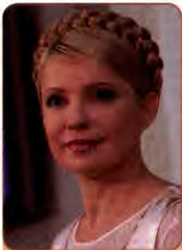
Юлія Тимошенко – Прем'єр-міністр України. 2005 р., грудень 2007 – березень 2010 р.

Взагалі політика Ю. Тимошенко була спрямована на обмеження крупного бізнесу, контроль над цінами, спроби переглянути наслідки приватизації часів президентства Л. Кучми. Наводилися різні дані про кількість підприємств, які планувалося повернути державі, а згодом перепродати, – від 30 до 3000. Частина суспільства це сподобалося, але приватний капітал і зарубіжні інвестори були в паніці. Ділитися з бідними багаті в такий спосіб відмовлялися. Замість економічних важелів впливу на економічну ситуацію Прем'єр-міністр схилилася до управління в ручному режимі. Ділова активність згортала-ся. Це негативно позначилося на економічних показниках. Наприкінці літа 2005 р. стосунки Прем'єр-міністра і Президента, в якого були інші, суто ліберальні погляди на економічну політику, загострилися.