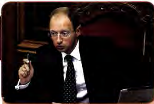
Арсеній Яценюк – Голова Верховної Ради України. Грудень 2007 – листопад 2008 р.

Президента. Врешті, політичні опоненти скористалися ситуацією: після залаштункових переговорів була досягнута домовленість про створення так званої антикризової коаліції, яка включала Партію Регіонів, соціалістів і комуністів. На посаду Голови Верховної Ради було проведено О. Мороза, а Прем'єр-міністром став В. Янукович. БЮТ і «Наша Україна» стали в опозицію до парламентської більшості й уряду В. Януковича.