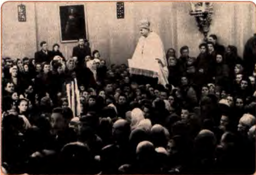
Г. Костельник промовляє після богослужіння. Львів. 1949 р.

Жертвою репресій стала й Українська греко-католицька церква (УГКЦ), яка на період закінчення Другої світової війни мала 3040 громад, 4400 церков, 127 монастирів, близько 4 тис. священнослужителів та 5 млн віруючих. Московська правляча верхівка вбачала в українських греко-католиках потенційного ворога, який створював ідеологічне підґрунтя національно-визвольної боротьби в західних областях. Радянське керівництво ініціювало «саморозпуск» УГКЦ. 11 квітня 1945 р. заарештовано значну кількість єпископів УГКЦ на чолі з митрополитом Йосипом Сліпим. Майже через рік (8 березня 1946 р.) у кафедральному храмі Св. Юра відбувся Львівський церковний Собор . На ньому «ініціативна група», очолювана єпископом Гавриїлом Костельником, запропонувала «возз'єднання УГКЦ» з московським православ'ям і повернення до Російської православної церкви, ліквідацію Берестейської церковної унії 1596 р. і повний розрив із Ватиканом.