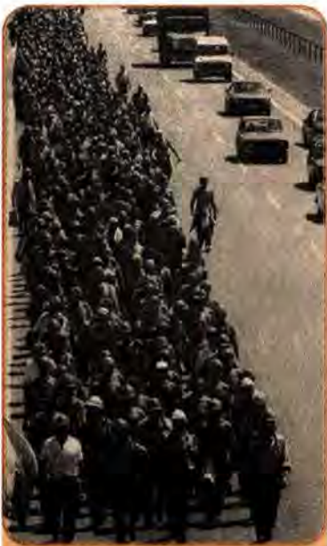
Колона шахтарів прямує на Київ. 1990 р.

передбачалося застосовувати надзвичайно серйозні санкції – штрафи, втручання прокуратури. Але цей указ не виконувався, і 14 грудня 1990 р. Президент змушений був підписати новий указ, у якому йшлося про необхідність виконання попереднього.