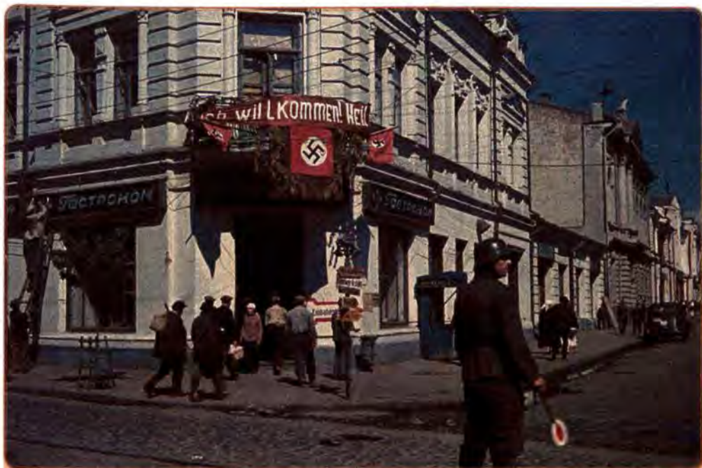
Місто Житомир за часів німецької окупації. 1942 р.

Гітлерівський план «Ост» передбачав перетворення України на колоніальну країну, аграрно-сировинний придаток рейху, «життєвий простір» для колонізації представниками «вищої раси». Місцеве населення, у тому числі українці, росіяни та інші, підлягали витісненню і навіть фізичному винищенню. Сотні тисяч жителів великих міст України стали жертвами організованого окупантами голоду. Протягом 103 тижнів окупації кожного вівторка і п'ятниці в Бабиному Яру в Києві розстрілювали людей різних національностей, переважно євреїв. Масове винищення євреїв увійшло в історію під назвою «холокост» («всепалення»). Свій «Бабин Яр» був у кожному великому місті України. Усього в перші місяці окупації України жертвами нацистів стали 850 тисяч євреїв. В окупації вижило мало. Частина з них своїм життям завдячує місцевому населенню – «праведникам миру» .