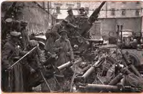
Трофеї, захоплені під час вересневої кампанії Червоної армії на Західній Україні. Львів. Вересень 1939 р.