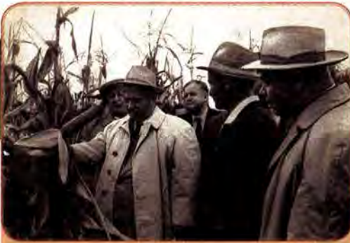
М. Хрущов оглядає врожай кукурудзи

зросли більш як удвічі, а валовий збір – лише в 1,3 раза. Практично незмінною – у межах 25–28 центнерів з гектара – залишалася врожайність кукурудзи. Очікуваного ефекту кукурудза не дала, зате в багатьох районах призвела до порушення сівозмін, структури ґрунтів, зниження врожайності зернових. Становище сільського господарства ускладнив також неврожай 1963 р.