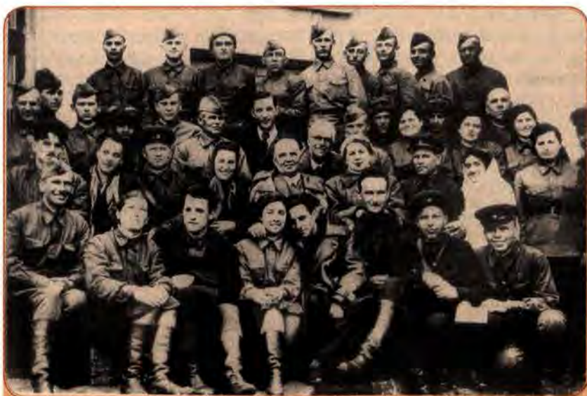
Артисти фронтової бригади Київського українського театру ім. І. Франка. В центрі – Г. Юра. 1942 р.

входили такі визначні діячі української культури, як З. Гайдай, І. Паторжинський, П. Вірський та ін.