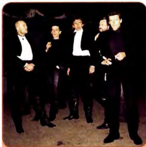
Культурний рок-гурт «Кому вниз», учасник фестивалю «Червона рута». 1990 рр.

Кіномистецтво України, що має сталі традиції, в роки незалежності значно