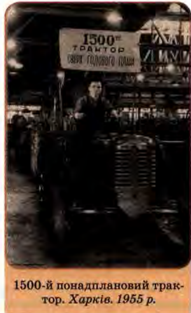
1500-й понадплановий трактор. Харків. 1955 р.

У СРСР формувалася військово-промисловий комплекс (ВПК) – підприємства, науково-дослідницькі центри, конструкторські бюро тощо, спрямовані на випуск продукції військового призначення найвищої якості. Багато таких підприємств і дослідницько-конструкторських закладів працювали в Україні.