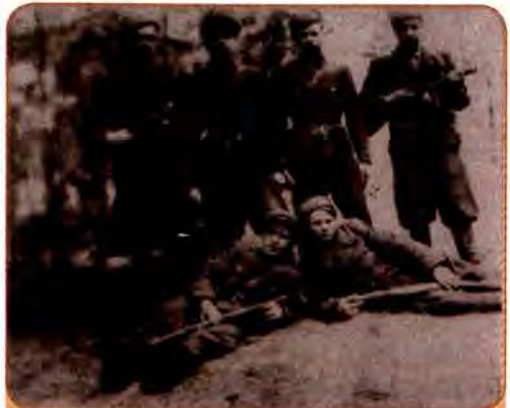
Неустійний відділ УПА. Волинь. 1940-ві рр.

Волинь з Поліссям стали центром формування УПА не випадково. Тут окупанти провадили особливо жорстоку політику. Було спалено село Кортеліси на Ковельщині, а його жи-