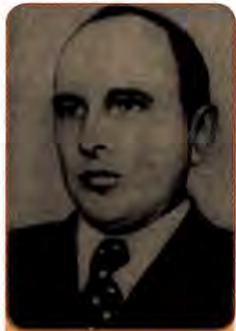
Степан Бандера – провідник ОУН і УПА

Перші дні війни засвідчили безпідставність надій на досягнення бодай обмеженої незалежності з допомогою Німеччини. Ввечері 30 червня , одразу ж після відступу радянських військ зі