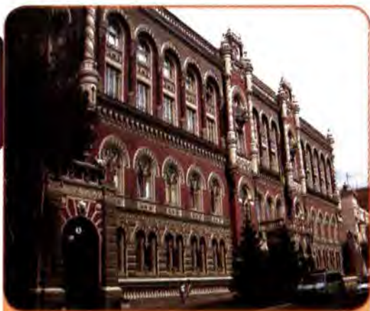
Будинок Національного банку України. Київ

кову службу України, у червні 1991 р. був прийнятий Закон про митну справу в Україні. Повноцінна діяльність цих органів державного управління почалася після проголошення незалежності.