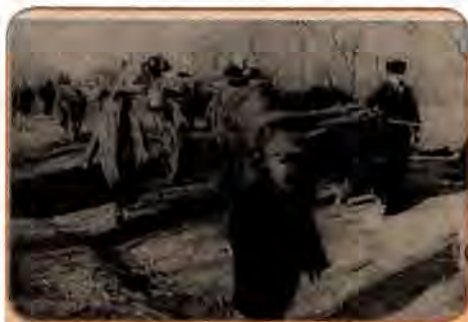
Мешканці м. Каховка на Херсонщині повертаються в рідні домівки. 1943 р.

Увесь жовтень радянське командування концентрувало війська на правому березі Дніпра, готуючись до продовження наступу. Прагнучи підкреслити виняткову важливість цих операцій і піднести бойовий дух військ, які з виходом в Україну поповнювалися здебільшого за рахунок місцевих жителів, Ставка перейменувала 20 жовтня 1943 р. Воронежський, Степовий, Південно-Західний і Пів-