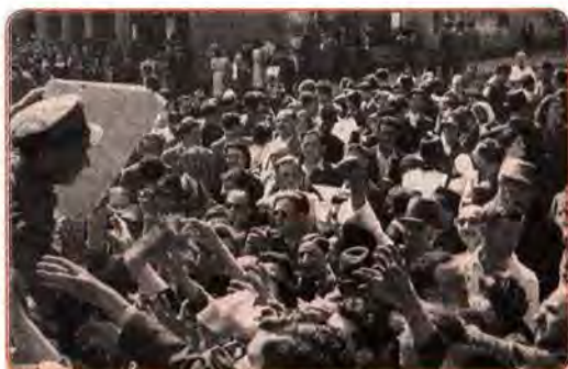
Чернівці. Після приєднання Північної Буковини до СРСР. Червень 1940 р.

тієї частини Північної Буковини, де проживало переважно українське населення. Не маючи підтримки від Німеччини, уряд Румунії віддав своїм частинам наказ залишити вказані в ультиматумі території. Там була встановлена радянська влада. Північна Буковина і придунайські українські землі ввійшли до складу УРСР. Законодавче закріплення нових територій у складі Радянського Союзу відбулося шляхом створення нової союзної республіки – Молдавської РСР і поділу території Бессарабії між Молдавською та Українською РСР.