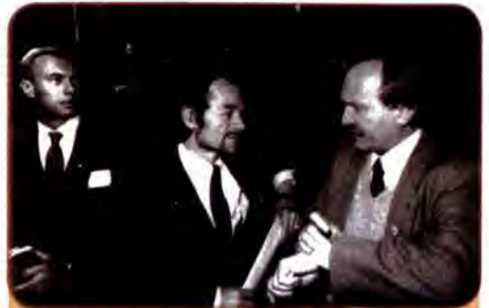
Народний депутат України Вячеслав Чорновіл і Голова Меджлісу кримськотатарського народу Мустафа Джемілев. Сімферополь. 1992 р.

Однак це не заспокоїло сепаратистів. У січні 1993 р. на виборах президента АРК їм вдалося привести до перемоги лідера Республіканської партії Криму Ю. Мешкова. Останній, незважаючи на зваженість та толерантність політики Києва щодо Криму, одразу ж узяв курс на рішучу конфронтацію. З грубим порушенням чинного загальноукраїнського законодавства було прийнято у травні 1994 р.