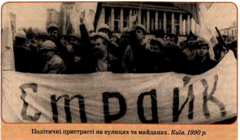
Політичні пристрасті на вулицях та майданах. Київ, 1990 р.

Здобувши перші перемоги, опозиція продовжувала тиск на владу. Це продемонстрували II Всеукраїнські збори Народного руху України, які відбулися з 25 по 28 жовтня 1990 р. у Києві. Збори внесли зміни до статуту і програми цієї громадсько-політичної організації. З її назви були вилучені слова «за перебудову». Нова стратегія накреслювала шляхи боротьби за досягнення незалежності. Це був повний розрив з лінією Компартії України. Налякана радикалізацією громадського руху в Україні і постановою Верховної Ради щодо вимог студентів Компартія республіки готувалась до контрнаступу. Спираючись на депутатську більшість у Верховній Раді, ско-