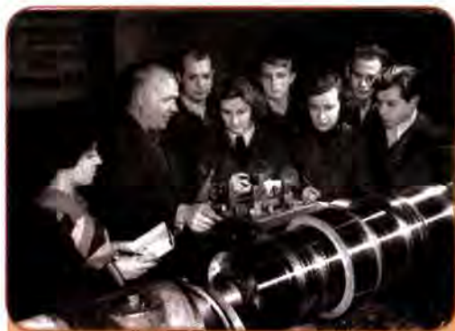
Токар турбінного заводу ім. С. Кірова зі студентами Московського енергетичного інституту. Харків. 1956 р.

Далекосяжні задуми керівництва КПРС реалізувалися в умовах, коли бюджетні асигнування на найнеобхідніше – освіту, науку, культмасову роботу, не кажучи вже про театр, живопис, кіно та інші види мистецтва – в Україні в розрахунку на душу населення були нижчими, ніж у Росії і деяких інших республіках СРСР, зокрема в Прибалтиці. «Залишковий принцип» забезпечення соціально-культурної сфери, характерний для СРСР у цілому, особливо гостро і пекуче відчувався в Україні.