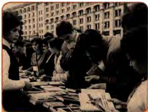
Продаж книжок на Хрещатику у Києві. 1970 р.

У системі культосвітньої роботи значне місце посідали бібліотеки, яких на середину 1980-х років налі-