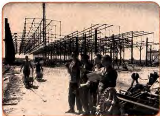
На побудові головного цеху Львівського автобусного заводу. 1948 р.

У 1949 р. в західних областях України діяло 2500 великих і середніх промислових підприємств. Кількість