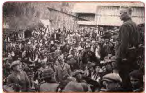
О. Довженко промовляє на передвиборчих зборах в одному з гуцульських сіл. 1939 р.

У квітні – травні 1940 р. у Катинському лісі під Смоленськом, а ще раніше під Харковом та в інших місцях було розстріляно понад 15 тисяч польських офіцерів – від молодших командирів до генералів.