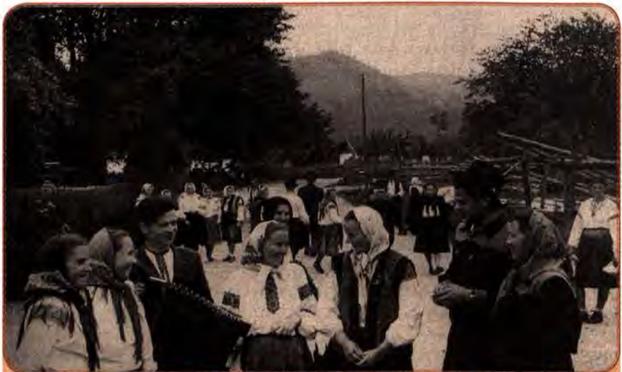
Молодь с. Космач на Станіславщині (сучасна Івано-Франківська обл.) у години дозвілля. 1959 р.

Після вересневого (1953) пленуму ЦК КПРС помітні зрушення відбулися в оплаті праці колгоспників. Замість оплати один раз на рік було введено помісячне, подекуди – поквартальне грошове та натуральне авансування. Видача продукції на трудодні стабілізувалася, а грошова оплата зросла більш ніж у чотири рази. У 1956 р. на 80 % було збільшено розміри пенсій, хоча колгоспни-