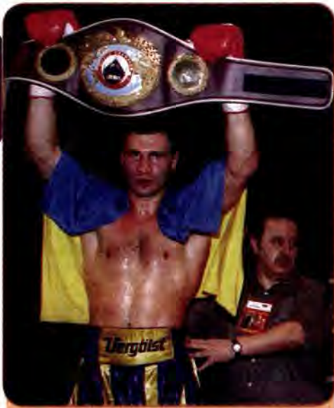
Боксер Віталій Кличко піднімає над головою свій пояс чемпіона світу за версією WBO після перемоги над Х. Хайдом. Лондон. Червень 1999 р.

Проводяться заходи щодо відновлення фізкультурно-оздоровчої та спортивно-масової роботи в мікрорайонах, за місцем проживання. Завдання полягає в тому, щоб охопити фізичною культурою максимальну кількість дітей. Адже мова йде про здоров'я нації, боротьбу зі шкідливими звичками, здоровий спосіб життя, ліквідацію підліткової злочинності, наркоманії, бездоглядності та інших негативних явищ.