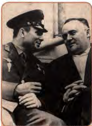
Ю. Гагарін та С. Корольов. Москва. 1961 р.

науково-технічна революція (НТР), що супроводжувалася широким впровадженням у виробництво розробок нової техніки, інтенсифікацією виробничих процесів, механізацією і автоматизацією трудомістких робіт. НТР дала життя новим галузям промисловості, пов'язаним з виробництвом автоматичних і телемеханічних пристроїв, електронно-обчислювальних машин, штучних матеріалів, розвитком атомної енергетики тощо. Традиційні галузі індустрії – класична металургія, видобуток вугілля, важке машинобудування – вже не визначали рівень економічної могутності держави. Проте ці галузі були найрозвиненішими в Україні. Саме тому на перший план вийшли питання модернізації, структурної перебудови промисловості УРСР.