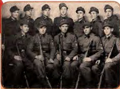
Вояки-українці дивізії СС «Галичина». Львів, 1943 р.

Відмовившись від визнання української державності, гітлерівці разом з тим прагнули використати людські ресурси України як «гарматне м'ясо». У складі Вермахту діяли військові підрозділи, сформовані в окремих країнах Європи. Одним з них була дивізія СС «Галичина», формування якої почалося навесні 1943 р. зусиллями мельниківців за активної участі В. Кубійовича – керівника єдиної легальної української організації на окупованих територіях – Українського центрального комітету. ОУН-Б агітувала проти формування дивізії, закликаючи юнаків поповнювати лави повстанської