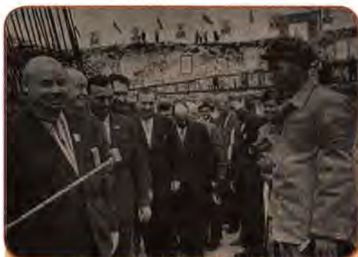
Урочисте закладення першого бетону на будівництві Трипільської ДРЕС. Перший ліворуч – П. Шелест. Київщина. 1964 р.

Широкий попит населення на товари повсякденного вжитку і побутові послуги, який держава виявилася неспроможною задовольнити, породив