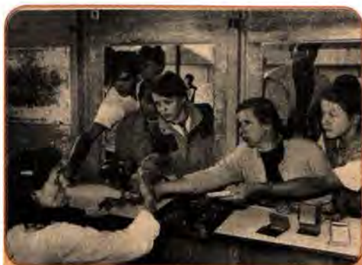
У черзі за хлібом перед підвищенням цін. Луганськ. 1992 р.

Одним з майже легальних способів цього було утворення при державних підприємствах великої кількості комерційних малих підприємств (МП). Саме під їх прикриттям розкрадалася народна власність, а гроші перекачувалися за кордон. Так, у 1992 р. Росія згідно з укладеним договором поставила в Україну 32 млн т нафти. Її ціна була в 10 разів нижча за світову. Протягом короткого часу 8 млн т цієї нафти було продано за допомогою МП за кордон. Гроші осіли на приватних рахунках іноземних банків. Україна