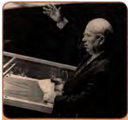
Микита Хрущов виступає на сесії Генеральної Асамблеї ООН. Нью-Йорк. 1 жовтня 1960 р.

Проявом цього стала фактична заборона для вітчизняного читача (аж до 1989 р.) самого тексту доповіді М. Хрущова на XX з'їзді. Громадянам СРСР запропонували її «полегшену» версію: у липні 1956 р. було опубліковано постанову ЦК КПРС «Про подолання культу особи та його наслідків». За змістом і гостротою викладу цей документ став кроком назад порівняно з доповіддю. Та й сам М. Хрущов поступово почав змінювати тональність виступів. У ряді промов він говорив, що Сталін – це «великий революціонер», «великий марксист-ленінець», і партія не дозволить «віддати ім'я Сталіна ворогам комунізму».