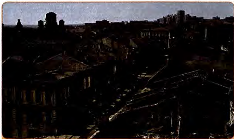
Харків. Руїни центральної частини міста. 1943 р.

У час, коли тоталітарний сталінський режим відновлював контроль над Україною, регулярні частини Червоної армії вели кровопролитні наступальні бої за її кордонами. На цьому етапі війни кожен 4–5-й червоноармієць був жителем України. Своїм ратним подвигом у складі багатонаціональних радянських з'єднань вони наближали спільну перемогу над нацистською Німеччиною, яка прийшла 9 травня 1945 р. , і забезпечували розгром милітаристської Японії, із завершенням якого 2 вересня 1945 р. пов'язане закінчення Другої світової війни.