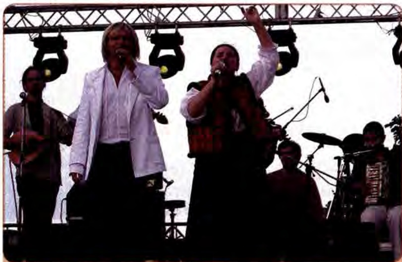
О. Скрипка та Н. Матвієнко виступають на етнічному фестивалі «Країна Мрій», 2007 р.

Незважаючи на велику кількість законодавчих актів, спрямованих на захист свободи слова, прав журналістів та інших громадян України, у більшості випадків законодавство неефективне у відстоюванні інтересів журналістів.