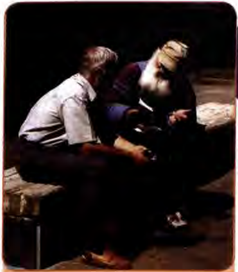
Пенсіонери обговорюють останні новини. Київ. 1993 р.

Життя змушує шукати нові системні підходи. Зокрема, пропонується введення накопичувальної системи, коли кожен громадянин матиме свій