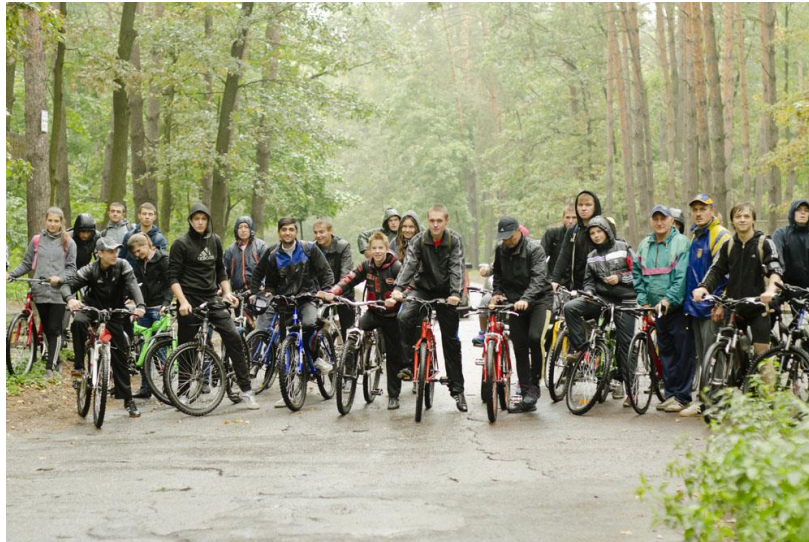
Велопробіг «За здоровий спосіб життя»

Кожного року на початку вересня студенти і викладачі коледжу беруть участь у велопробігу: «За здоровий спосіб життя» до різних міст Сумського району: Миропілля, Токарі, де знайомляться з живописними куточками нашого мальовничого краю.