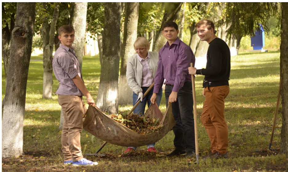
Прибирання у Веретенівському парку

Акція: «Плекаємо нашу перлину – Веретенівський парк»