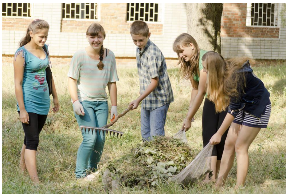
Робота гуртка «Юні екологи»

Також студенти коледжу постійно беруть участь в конкурсах «Зелена фортеця» (внутрішнє і зовнішнє озеленення), працюють на клумбах, займаються озелененням своїх аудиторій. У нашому навчальному закладі діє Трудовий десант і Зелений патруль. Студенти мають свої закріплені території, де слідкують за чистотою і порядком та здійснюють її благоустрій. Це виховує у них працелюбність, охайність, почуття відповідальності та гордості за свою роботу.