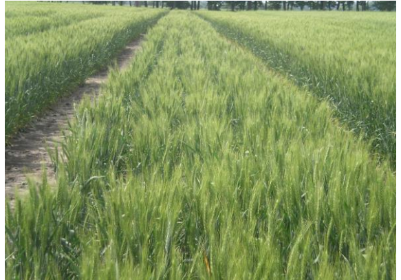
Розсадник випробувань нащадків пшениці 1-го року