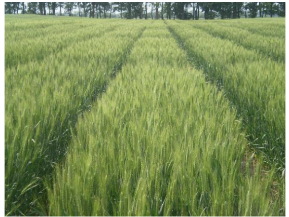
Розсадник випробувань нащадків пшениці 2-го року