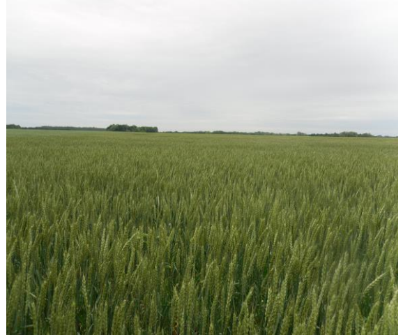
Розсадник розмноження пшениці 1-го року

Кращі за продуктивністю потомства, що за морфотипом, фенофазами та імунністю не відхиляються від типовості сорту, висівають (не менше 120 потомств) у розсаднику випробування потомств другого року (РВ2р). Польові спостереження, облік, оцінку та вибракування проводять за схемою, аналогічною РВ1р. Потім кожен ділянку, що залишилась після оцінки, збирають, зерно очищують та зважують. Кращі родини об'єднують і висівають у розсаднику розмноження першого року (РР1р).